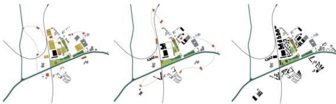
Illustration 2 : Schéma de l'évolution prévue à l'origine pour le projet du parc au fil des aménagements temporaires

Dans le cas du premier projet, la phase à laquelle on s'intéresse est terminée, le parc est en chantier et il est possible d'amorcer un bilan de l'expérience. Le constat est, de manière a priori assez unanime parmi les différents acteurs, que le processus de préfiguration temporaire et d'implication des habitants et le processus de conception du futur parc se sont progressivement détachés l'un de l'autre, aboutissant à une situation où l'on ne retrouve quasiment aucun élément de l'expérimentation dans le projet final ( Illustration 2 ). Pourtant, il existait au démarrage une solidarité très forte entre ces deux dimensions, pensées pour évoluer ensemble sur plusieurs années, portées conjointement par un unique maître d'œuvre et une maîtrise d'ouvrage enthousiaste ( Illustration 3 ).