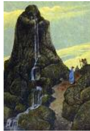
Resim 2a-b / Figures 2a-b: Çocukları için göz yaşı akıtan Niobe: a. Ağlayan Kaya (Wikicommons); b. Marshall 1914, 40 / Niobe weeping her children: a. Ağlayan Kaya (Wikicommons); b. Marshall 1914, 40.