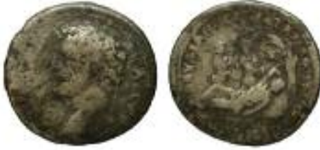
Resim 5 / Figure 5: İskenderin Pagos dağındaki rüyasını tasvir eden Bronz Marcus Aurelius sikkesi.: Klose 1987, taf. 39-40, V.1-R.4 / Bronze coin of Marcus Aurelius, representing the dream of Alexander on the mount Pagos: Klose 1987, taf. 39-40, V.1-R.4.