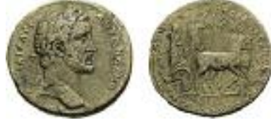
Resim 3 / Figure 3: Pelops ve Hippodameia tasvirli Antoninus Pius'a ait bronz sikke: Klose 1987, taf. 38 V.8-R.8 / Bronze coin of Antoninus Pius, representing Pelops and Hippodameia: Klose 1987, taf. 38 V.8-R.8.