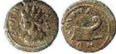
Resim 4 / Figure 4: Antoninler döneminden Bronz "pseudo-otonom" sikke, bir yüzünde omuzunda labrys tutan kule başlıklı Amazon Smyrna tasviri, diğer yüzünde germi pruvası tasviri yer almaktadır.: Klose 1987, taf. 9-10 V.8-R.23 / Bronze "pseudo-autonomous" coin of Antonine times, representing the turreted bust of the Amazon Smyrna with a labrys over the shoulder, and a prow on the obverse: Klose 1987, taf. 9-10 V.8-R.23.