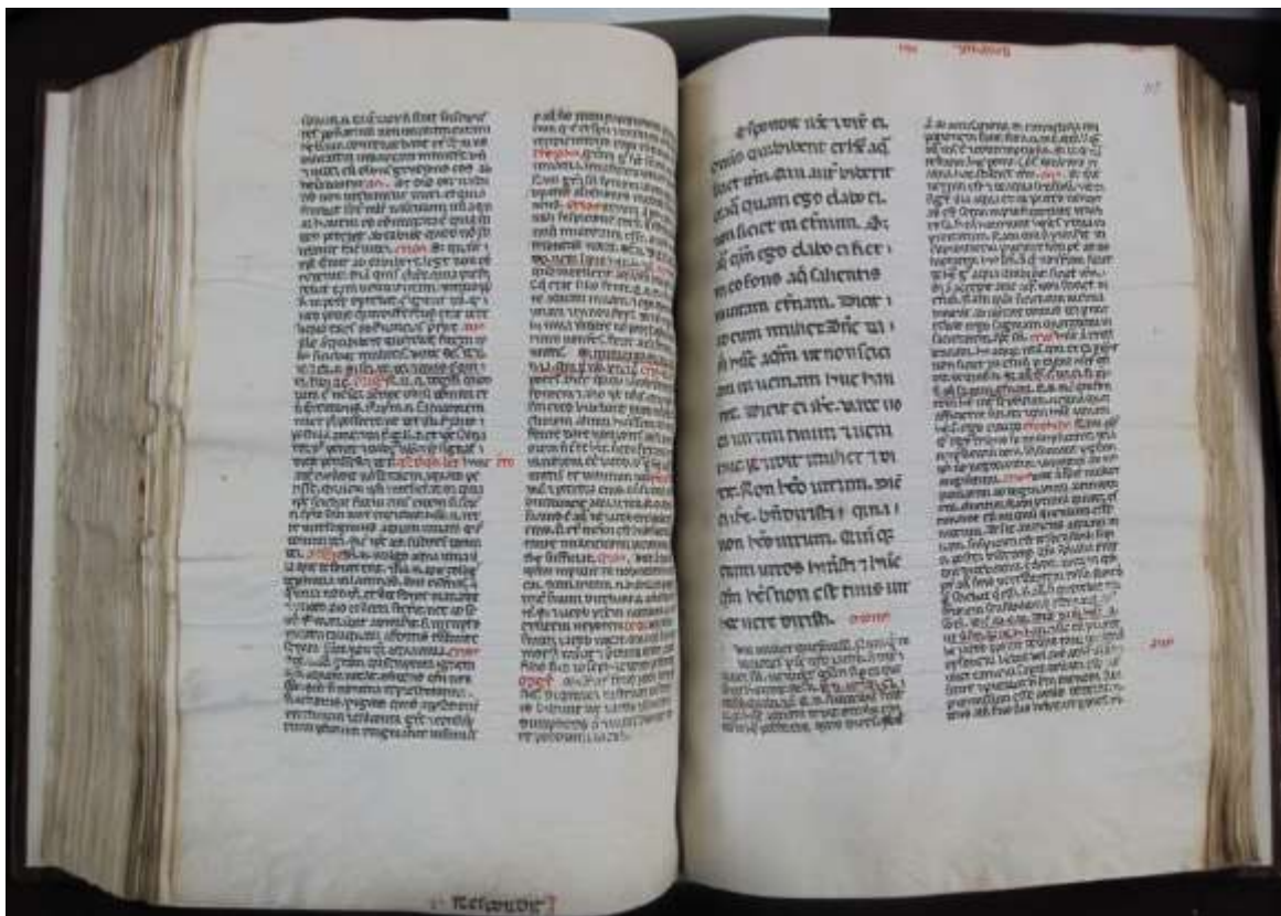
Page de la Catena aurea sur l'évangile de Jean, premier quart du XIV e s., appartenait au couvent des Augustins de Toulouse en 1789 (Toulouse, Bibl. mun. 46)

=edit-body-und-0-value&Toolbar=Wysiwyg - ftu2 . Il en prit occasion pour composer sa « Catena aurea » ( Chaîne d'or ), nom moderne donné à un commentaire continu des quatre évangiles composé comme une mosaïque de fragments découpés dans les commentaires patristiques des passages correspondants, et collés à la suite de chacun des passages des évangiles reproduits en gros caractères. La Catena a été rédigée en Italie, d'abord à Orvieto puis à Rome, entre 1263 et 1266 environ, et dédié d'abord au pape Urbain IV, puis à l'ancien élève et ami de Thomas d'Aquin, le désormais cardinal Annibald de Annibaldi.