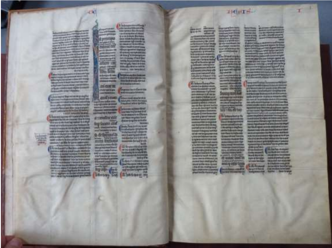
Bible glosée parisienne (Gn), premier quart du XIIIe s., provient du couvent des Jacobins de Toulouse (Toulouse, Bibl. mun. 21)

Vers 1230/1235, sous la conduite d'Hugues de Saint-Cher, l'école dominicaine de Paris, lointaine anticipatrice de l'École biblique de Jérusalem, mena à son terme une entreprise pharaonique : l'édition d'un corpus de commentaires ou postilles, selon le sens littéral et selon le sens moral, étendu sur pratiquement toute la nouvelle édition de la Vulgate latine publiée à Paris dans le contexte de l'Université. Les postilles d'Hugues de Saint-Cher prirent de telles dimensions que le texte biblique intégral n'y fut plus reproduit. Victime de leur ampleur, elles furent peu copiées.