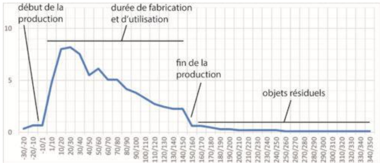
Figure 1 – Exemple de courbe de datation probabiliste pondérée commenté (DAO E. Vigier)

Une fois les taux obtenus et regroupés dans un tableau répartis par tranches chronologiques, la somme de ces coefficients nous donne un indice d'effectif de l'objet par unité de temps. Ce dernier cumule alors les datations contextuelles sur une même base comparative, et permet de rendre compte de la durée de vie d'un objet.