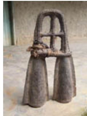
Fig. 4. Cloche double nkén des Beti Eton du Cameroun.

Un des lieux communs est de s'émerveiller devant le fait que "l'on peut tout dire" avec ce système. Effectivement, on peut tout dire, mais sera-t-on pour autant toujours compris ? Évidemment non, puisque plusieurs mots, plusieurs énoncés peuvent posséder un schème tonal identique.