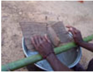
Fig. 10. Harpe-cithare ngombi des Baka du Cameroun, © S. Fürniss 2006.

répertoriés en Centrafrique ou au nord du Congo depuis les années 50 sont parfaitement identiques à ceux d'aujourd'hui. On peut donc aujourd'hui considérer qu'elle est tout à fait identitaire de cette culture (Fürniss 2012b).