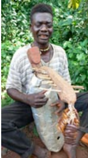
Fig. 6. Harpe arquée ngombi des Ngbaka-Mabo de Centrafrique, © A. Epelboin 2006.

Les trompes – qu'elles soient en corne, en bois, en racine ou en écorce – produisent des sons d'une rugosité acoustique considérable.