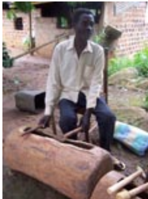
Fig. 3. Tambour de bois nkúl des Beti Eton du Cameroun, © S. Fűrmiss 2009.

Les instruments utilisés relèvent de toutes les classes organologiques, mais ce sont les tambours – de bois ou à membrane – qui sont le plus utilisés. Je parlerai donc désormais par commodité de langage tambouriné.