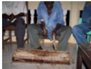
Fig. 8. Tronc de bananier nzinde , accompagnement rythmique des épopées ngiang des Ngoumba du Cameroun, © S. Fűrniiss 2013.

Pour conclure cette section sur les instruments supports d'épopées, je voudrais présenter ce qui fut pour moi une découverte toute récente, en décembre 2013. Je la relate pour mettre en garde avec insistance contre les généralisations abusives qui – on l'a vu avec l'anecdote de Jean Kidula qui ouvre ma contribution – peuvent être à l'origine d'un écartement de cultures qui ne correspondent pas tout à fait au lieu commun. Les peuples kwasio du Sud-Cameroun (Ngoumba et Mabi notamment) accompagnent leur épopée avec la harpe-cithare ngiang . Voilà la règle culturelle. Or, il se peut que les chants du conteur soient accompagnés du simple frappement régulier d'une section de tronc de bananier, nzinde . Serait-ce alors une performance inexacte, diluée, pour touristes pour ainsi dire ? Non, pas du tout. Contrairement à d'autres sociétés de la région, les Ngoumba ont en effet mis en place un système d'initiation à la fonction de conteur d'épopées qui prévoit deux stades d'initiation dont seulement le second stade donne droit à la manipulation de la harpe-cithare. On peut donc tout à fait entendre des conteurs de ngiang qui ne jouent pas du ngiang . Ils ne bénéficient peut-être pas du même renom que les autres, mais ils sont autant sollicités pour les veillées, car ils sont appréciés pour leurs talents de conteur et d'acteur. Le Ngiang – l'épopée – peut donc être accompagné du tronc de bananier nzinde en lieu et en place du ngiang – la harpe-cithare.