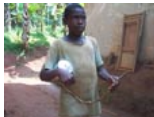
[28] Fig. 11. ntchá'ántùbà, harpe monocorde, jouet des garçons beti eton du Cameroun, © S. Fűrnis 2009.

Comme illustration, prenons ce jouet d'enfant qu'est la harpe-en-terre – souvent encore appelée de manière incorrecte "arc-en-terre" – qui existe en Afrique centrale et bien au-delà. La variation des matériaux et la moderni-