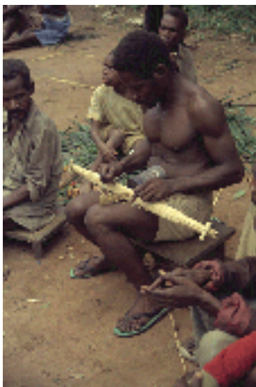
Fig. 9. Harpe-cithare bôgôngó des Aka de Centrafrique, © S. Fürniss 1990.

Je voudrais revenir aux harpes-cithares, notamment à ceux joués par les Pygmées Aka et Baka. Ils jouent de cet instrument pour accompagner soit des chants rappelant le héros civilisateur, soit des chants de chasse et d'amour. Dans sa zone de répartition, la harpe-cithare – appelée mvét dans la majorité des cas – est traditionnellement de facture idiocorde, les cordes étant détachées de l'écorce du bâton de raphia qui constitue le corps de l'instrument. Ceci était le cas chez les Baka du Cameroun, dont le ngombi est muni de quatre cordes, aujourd'hui en câble. Leur instrument se distingue des autres instruments de ce type dans la région par une table d'harmonie en moelle de raphia attachée au chevalet que les Baka ne partagent qu'avec les Pygmées Bakoya du Gabon (cf. Le Bomin & Mbot 2012).