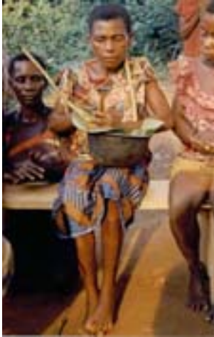
Fig. 1. Arc musical à deux cordes èngbítí des Aka de Centrafrique, © S. Fürniss 1990.