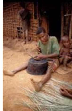
Fig. 2. Arc musical à deux cordes língbídí des Baka du Cameroun, © S. Fürniss 1999.

Je m'avance déjà un peu dans la troisième partie de mon exposé pour vous montrer qu'en RCA et au Cameroun, c'est un instrument des femmes pygmées, aka en RCA et au Congo et baka au Cameroun (Fürniss & Bahuchet 1995, Fürniss 2012b). S'il est indéniable – et bien connu entretemps – que ces deux sociétés sont issues d'une même société originelle (Bahuchet & Thomas 1986), elles ne sont cependant pas identiques. Ceci est aussi valable sur le plan musical. D'un point de vue technologique, cette différence se manifeste par exemple dans le rapport entre le résonateur et la courbure de l'arc. L'instrument aka est d'abord muni d'une feuille de Marantacée qui sert à elle seule de dispositif d'amplification suffisant. Afin d'en augmenter l'efficacité, l'ensemble est posé dans une marmite tenue par les jambes de l'instrumentiste. Chez les Baka, il n'y a pas de feuille, mais l'instrument est appuyé sur une marmite retournée posée sur le sol. La matière des cordes varie également : les Aka avec qui j'ai travaillé dans les années 1990 ont toujours utilisé une racine aérienne d'une liane Vanilla , alors que les Baka n'utilisent que des brins de câble métallique. Cette différence n'est toutefois pas pertinente pour distinguer les cultures, car les Baka ont également utilisé la Vanilla autrefois, la corde métallique étant une évolution technologique.