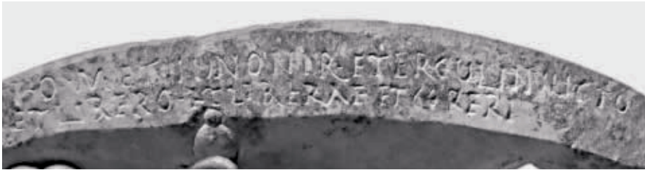
FIG. 2. Detalle del texto 1.

I(ovi) · Opt(imo) · M(aximo) et Iunoni R(eginae) · et (H)ercul(i) inv{I}icto et Libero · et Liberae et Cereri