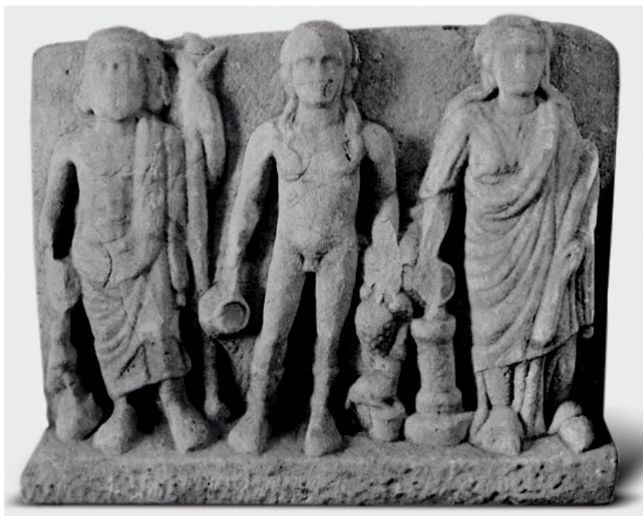
FIG. 7. Estela de Rudnik ( LIMC III [1986], s.v. Dionysos, 476 [C. Gasparri]).