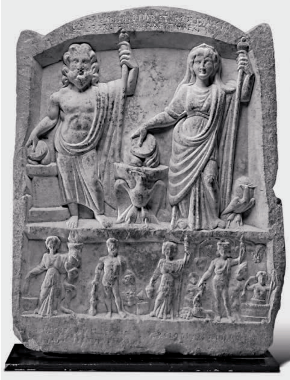
FIG. 1. Vista de la cara frontal de la pieza.

La estela (FIG. 1) está dividida en dos registros, superior e inferior, decorados ambos con una rica iconografía en relieve, siendo esta quizá su principal punto de interés. En el superior, de mayor tamaño, están representados Júpiter y Juno.