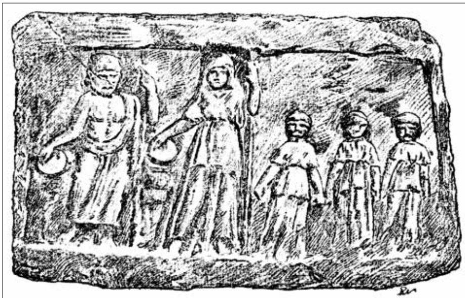
FIG. 6. Estela del Museo de Sofía (DOBŮRSKY 1897, 138, n° 93, fig. 17).