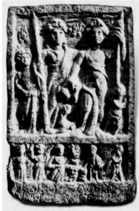
FIG. 10. Relieve de Pontes (PILIPOVIĆ 2005, 85, fig. 3).

Por último, la presencia en la escena de Ceres es, quizá, la más difícil de relacionar con el resto de personajes. No obstante, hay que tener en cuenta que Ceres es la diosa de la agricultura, vinculada en el Ilírico a Tellus , Terra Mater , con quien en ciertas ocasiones incluso se la asimila 5 a su vez a Diana o Roma. 6 No faltan, a pesar de todo, ejem-