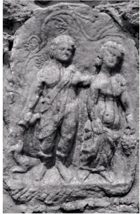
FIG. 9. Relieve de Barovo (PILIPOVIĆ 2011, tab. VIII, fig. 29).

presenta el mismo tipo iconográfico de Júpiter y Juno con vestimentas, atributos y situación similar. También tiene una inscripción dividida en dos registros (el segundo, a diferencia de la estela que presentamos, está incluido en una tabula ansata ) y ambos ejemplos comparten errores propios de una zona rural de Moesia en el que se ha utilizado un latín vulgarizado.