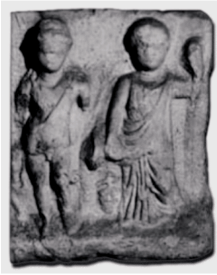
FIG. 8. Relieve de Vataš (DÜLL 1977, fig. 33).