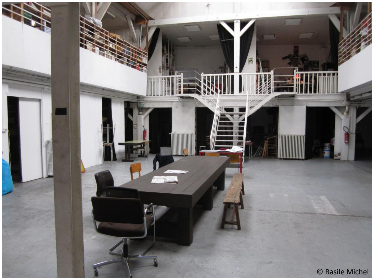
Figure 3. Espace mutualisé combinant les fonctions d'administration, de création et de diffusion artistique