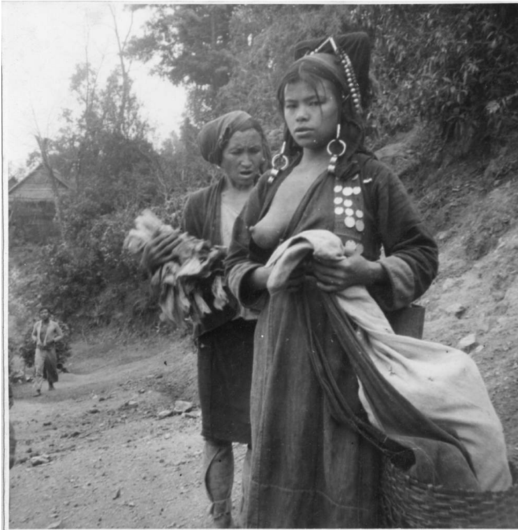
Photo 1. Femme Akha Nouheu, région de Phongsaly, vers 1950.