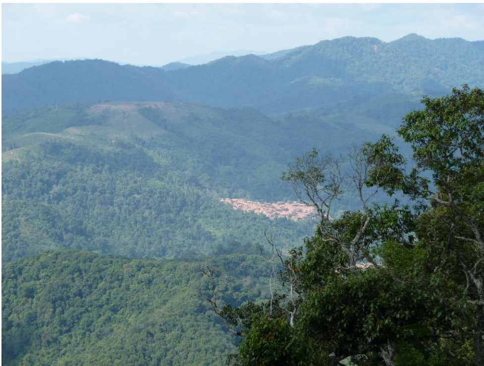
Photo 4. Un village d'essarteurs Akha du district de Boun Tai.

Ce village perdu dans la forêt rappelle que la région de Phongsaly fut durant longtemps faiblement peuplée. Avec l'augmentation de la pression démographique, des regroupements de villages le long des axes routiers et le développement des cultures commercial, cette photo ne sera bientôt qu'un souvenir.