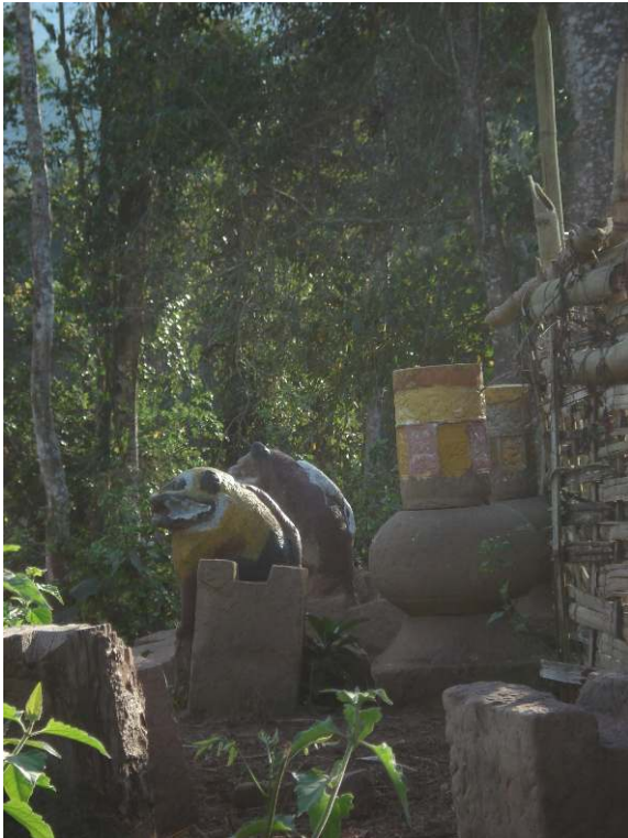
Photo 5. Les ruines d'un temple Tai Lü dans le district de Nyot Ou.

« Le paysage qui nous entoure est désert. À peine devine-t-on à flanc de coteau, de l'autre côté de la vallée, l'emplacement d'un ancien ray, déjà reconquis par une brousse épaisse. Ces régions ont cependant vu se succéder sans doute, depuis des siècles, de nombreuses agglomérations. Mais ici les hommes passent sans laisser le moindre écrit, le moindre signe sur une pierre et, tel que des ombres sur un mur, il ne reste rien de leurs pistes à peine visibles, de leurs cabanes croulantes, de leur agriculture primitive » écrivait Guillemet (1921 : 240) à propos de la région de Phongsaly. Les rares traces visibles du passé sont le fait des populations Lao et Tai Lü.