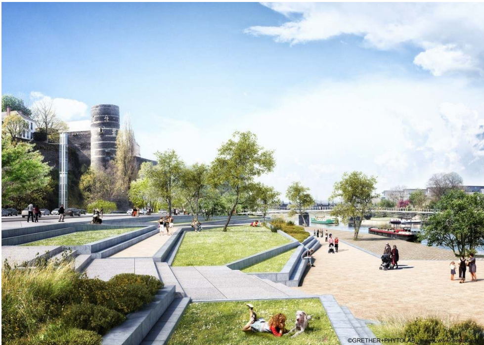
Figure 3. Les plis de la Maine, adaptation et paysage