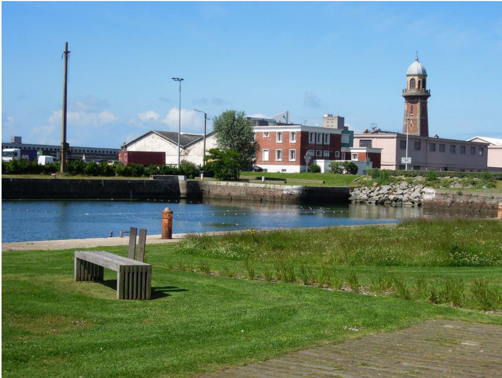
Figure 4. Reconquête paysagère de la zone industrialo-portuaire par la patrimonialisation