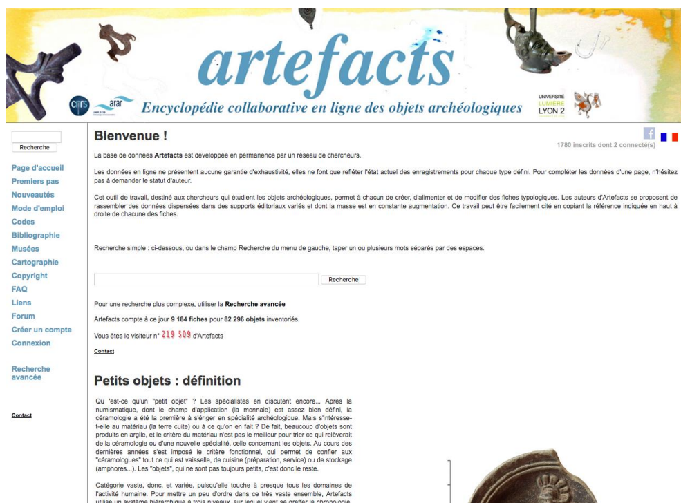
Figure 1. Page d'accueil d'artefacts.mom.fr

du Fer, l'Antiquité romaine, les périodes médiévale, moderne et contemporaine jusqu'au début du XX e s. Toutes les périodes ne sont pas traitées de manière aussi approfondie puisque le contenu est fonction du travail apporté par les auteurs qui enregistrent des données. Malgré tout, ce sont aujourd'hui plus de 300 000 objets qui sont réunis sur près de 20 000 fiches typologiques.