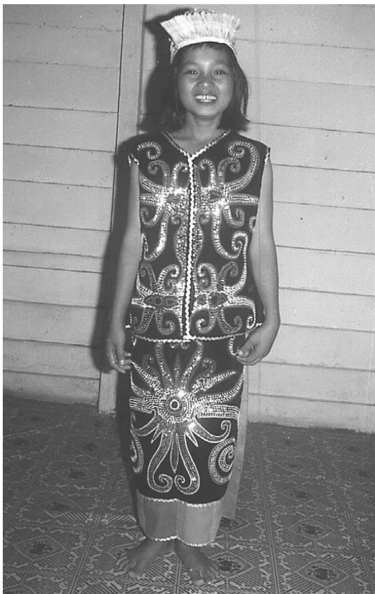
Young Kenyah girl in dance costume

La réserve de Kayan Mentarang, l'une des plus vastes zones protégées d'Asie du Sud-Est (1.6 M ha), est devenue un Parc National. Plusieurs dizaines de hameaux d'essarteurs et de chasseurs-collecteurs nomades sont localisés dans la réserve et alentour. Après une période de formation, une cinquantaine de chercheurs, indonésiens pour la plupart et incluant de nombreux Dayak, ont entamé des études de terrain. Ils ont produit de nombreux rapports scientifiques couvrant des thèmes variés et conduisant à la publication de deux importants ouvrages.