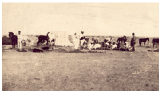
Camp de Btr Berradah.