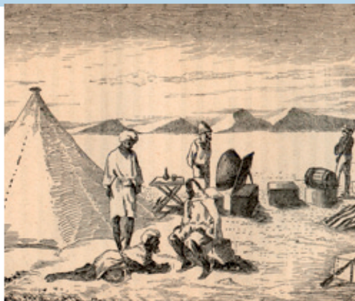
« Dès notre arrivée au camp nous installons l'appareil Mouchot » 196 .