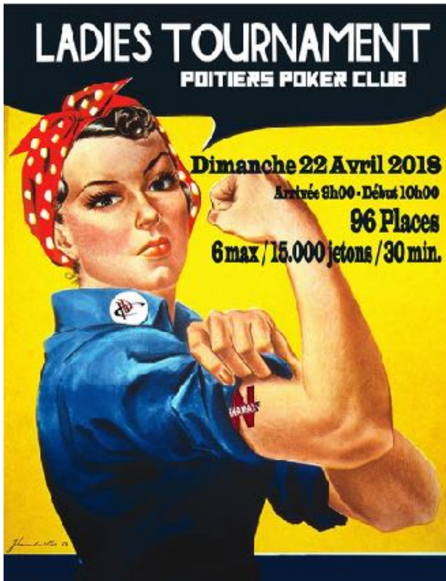
Image issue du site internet du PPC pour le tournoi réservé aux femmes

% d'hommes. Cette spécificité du poker est une réalité qui ne tient pas exclusivement de la pratique de club. L'ARJEL (2013) indique dans son étude que les joueuses de poker représentent 10 % de leur panel et qu'Aymeric Brody (2015) lors de son enquête n'obtient que 7,2 % de femmes. Ici, la surreprésentation des femmes par rapport aux autres enquêtes s'explique par une sensibilité plus grande à l'écrit des femmes (Lahire, p.578, 1995). A cela s'ajoute un faible panel (54 répondants) qui met en avant cette caractéristique de facilité d'écriture. Le fait que l'association organise un tournoi dédié exclusivement aux femmes pour promouvoir le poker auprès de « cette minorité » pousse peut-être aussi ces joueuses à vouloir sortir de l'invisible. Un autre élément qui amène de la visibilité à ces joueuses est la présence de leurs enfants pour une partie d'entre elles. Pourtant, l'échantillon recueilli montre que les joueuses ont proportionnellement moins d'enfants que les joueurs (0,7 enfant par joueuse contre 1,2 enfant par joueur). Cette observation indique le maintien d'une séparation