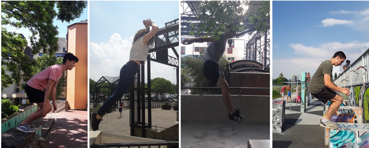
Couverture : Décomposition du saut de précision de Rennes à Nantes

Pour citer cet article : Lesné R., 2019, « Quand le déplacement devient une fin en soi. La pratique du parkour, une mobilité qui fait bouger l'urbanité », Urbanités , #11 / Bouger en ville, en ligne .