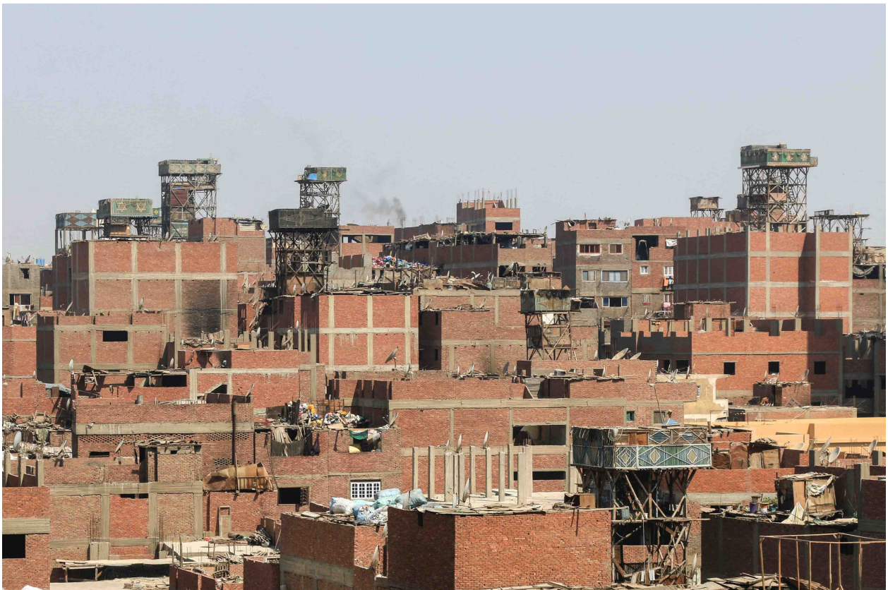
16. Vue sur les pigeonniers du quartier de Manshiyyet Nasr (Marie Piessat, juin 2017).