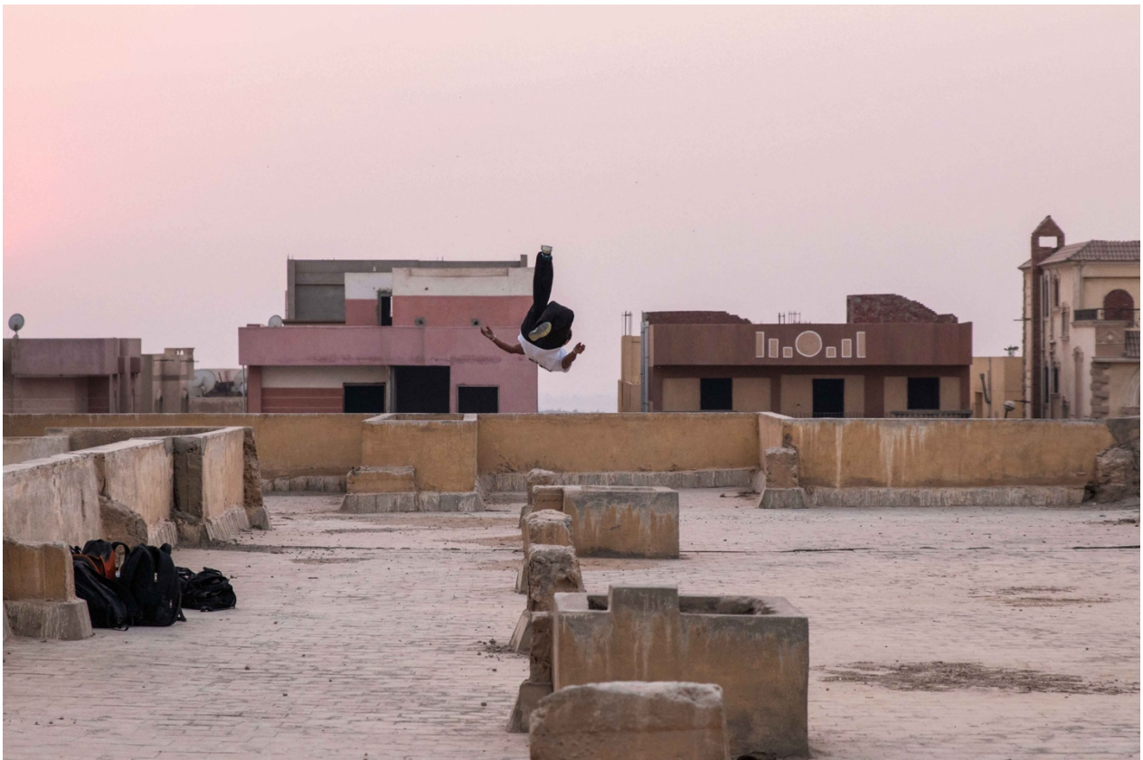
13. Le club Parkour Egypt organise parfois des séances d'entraînement en pleine air. Ici sur le toit d'une école abandonnée à Obour City, en banlieue du Caire (Marie Piessat, novembre 2017)