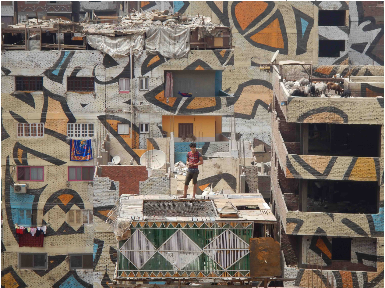
15. Un jeune éleveur surveille ses oiseaux du haut de son pigeonnier dans le quartier de Manshiyyet Nasr. Ces structures de bois sont construites par les éleveurs. Les coûts de construction varient de 1 000 (50 €) à 10 000 LE (500 €) selon la taille et la qualité du pigeonnier.