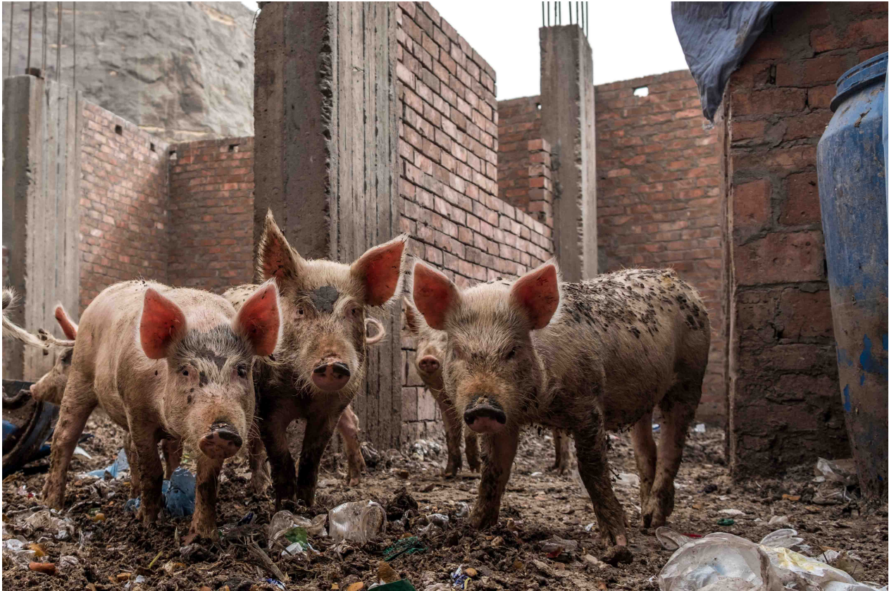
8. Manshiyyet Nasr est principalement peuplée de Coptes (chrétiens) qui pratiquent également l'élevage de porcs (Marie Piessat, avril 2018).