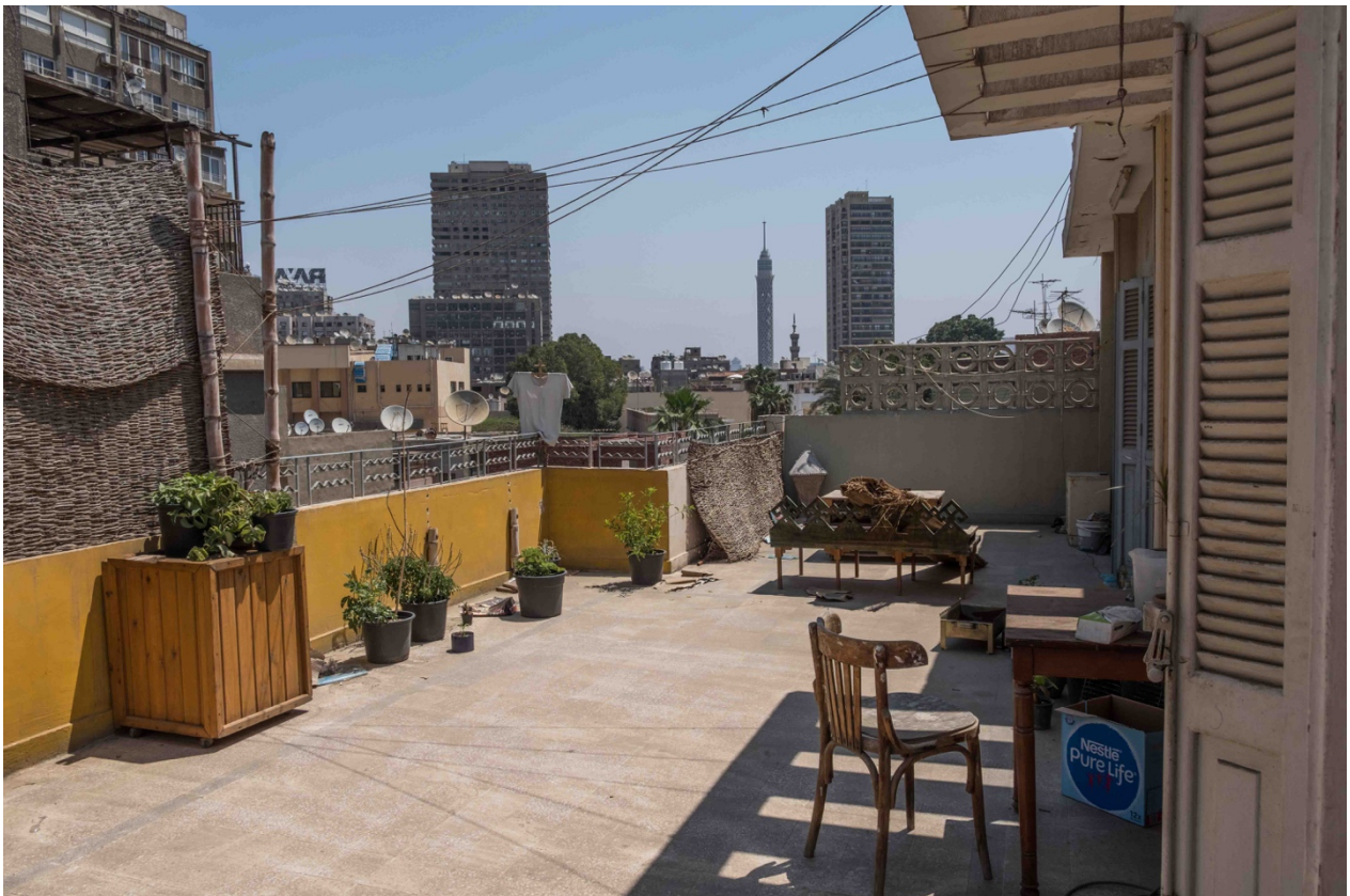
6. Terrasse de l'appartement d'un couple de jeunes mariés installés sur un toit à Dokki (Marie Piessat, avril 2018).