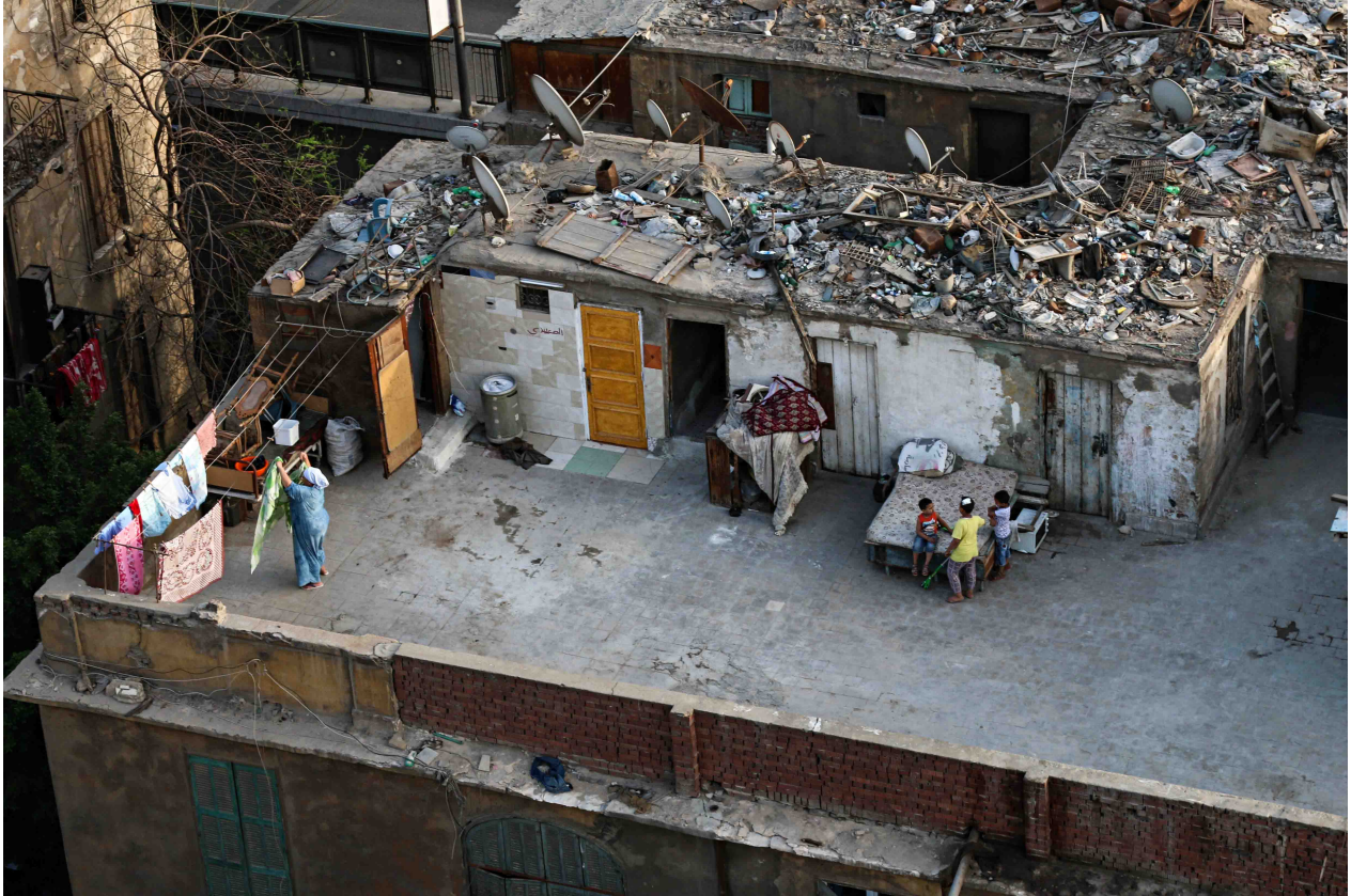
5. Vue sur le logement d'une famille à Boulaq. Le toit-terrasse offre un terrain de jeu plus sûr pour les enfants que la rue (Marie Piessat, avril 2017).