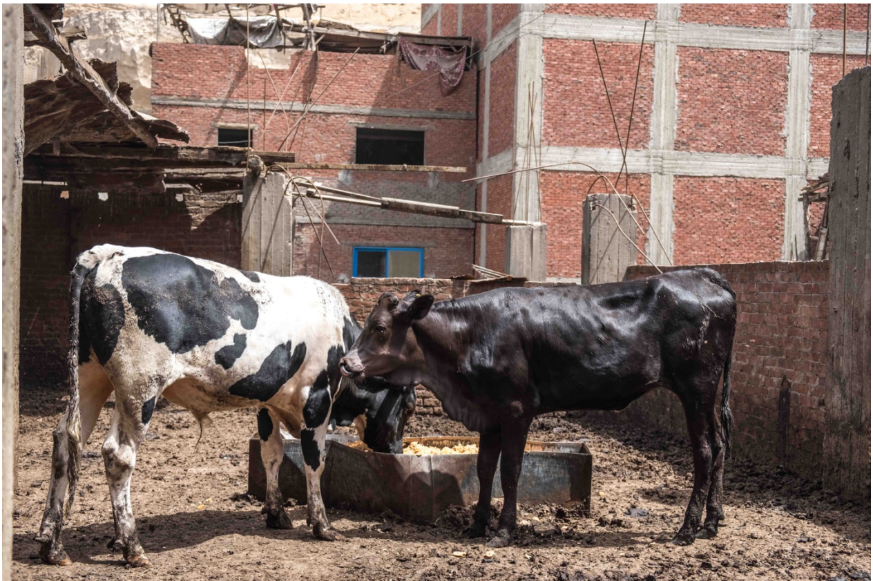
7. Les animaux sont élevés sur les toits-terrasses, ici à Manshiyyet Nasr (Marie Piessat, avril 2018).

Les toits-terrasses du Caire sont également connus pour héberger de hautes structures en bois : des pigeonniers. L'élevage de pigeons est pratiqué depuis des siècles en Égypte, notamment car sa viande est réputée (Gerardin, 2016). L'élevage de pigeons est relativement peu coûteux pour un connaisseur. Il faut compter une centaine de Livres par semaine (environ 5 €) pour nourrir une cinquantaine de pigeons. À la revente, certaines espèces peuvent atteindre les 1 000 LE (50 €) sur le marché, ce qui en fait un investissement intéressant. Les pigeons ne sont pas les seuls animaux à fréquenter les hauteurs de la ville. Volailles, lapins, moutons, chèvres, porcs et même vaches ou buffles sont relégués sur les toits lorsque l'espace manque au sol. C'est le cas dans le quartier de Manshiyyet Nasr où la densité de population est parmi les plus fortes au Caire. Le quartier produit ainsi près de 30 tonnes de viande de porc et 50 tonnes de viande de vache par mois, dont près des deux tiers proviennent d'élevages installés les toits et les derniers étages des immeubles du quartier. Les animaux sont principalement nourris des déchets organiques collectés et revendus par les chiffonniers. Cette production de viande est consommée au Caire et jusque dans les complexes hôteliers de la Mer Rouge 2 .