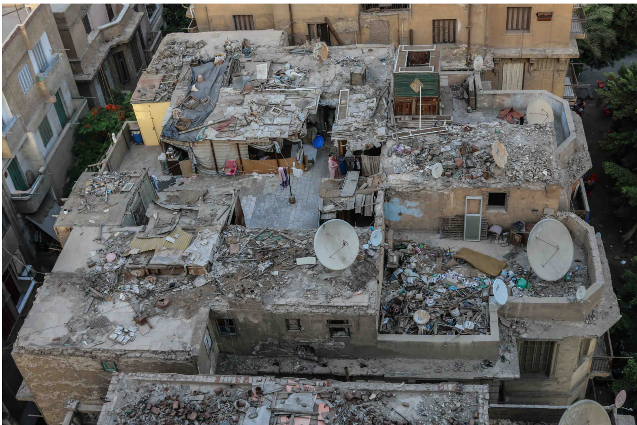
4. Vue plongeante sur le toit-terrasse d'un immeuble du quartier de Mounira. Plusieurs familles se partagent la terrasse et cohabitent autour de l'espace commun.