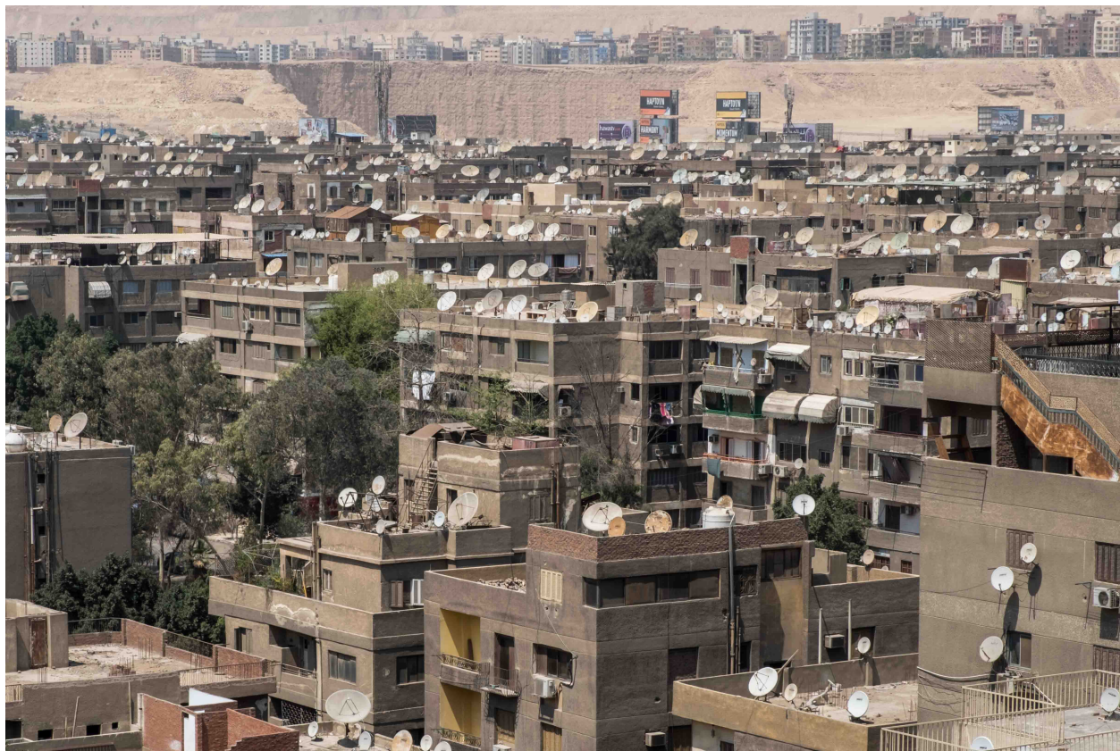
Toits du quartier résidentiel de New Maadi, au sud-est du Caire (Marie Piessat, avril 2018).