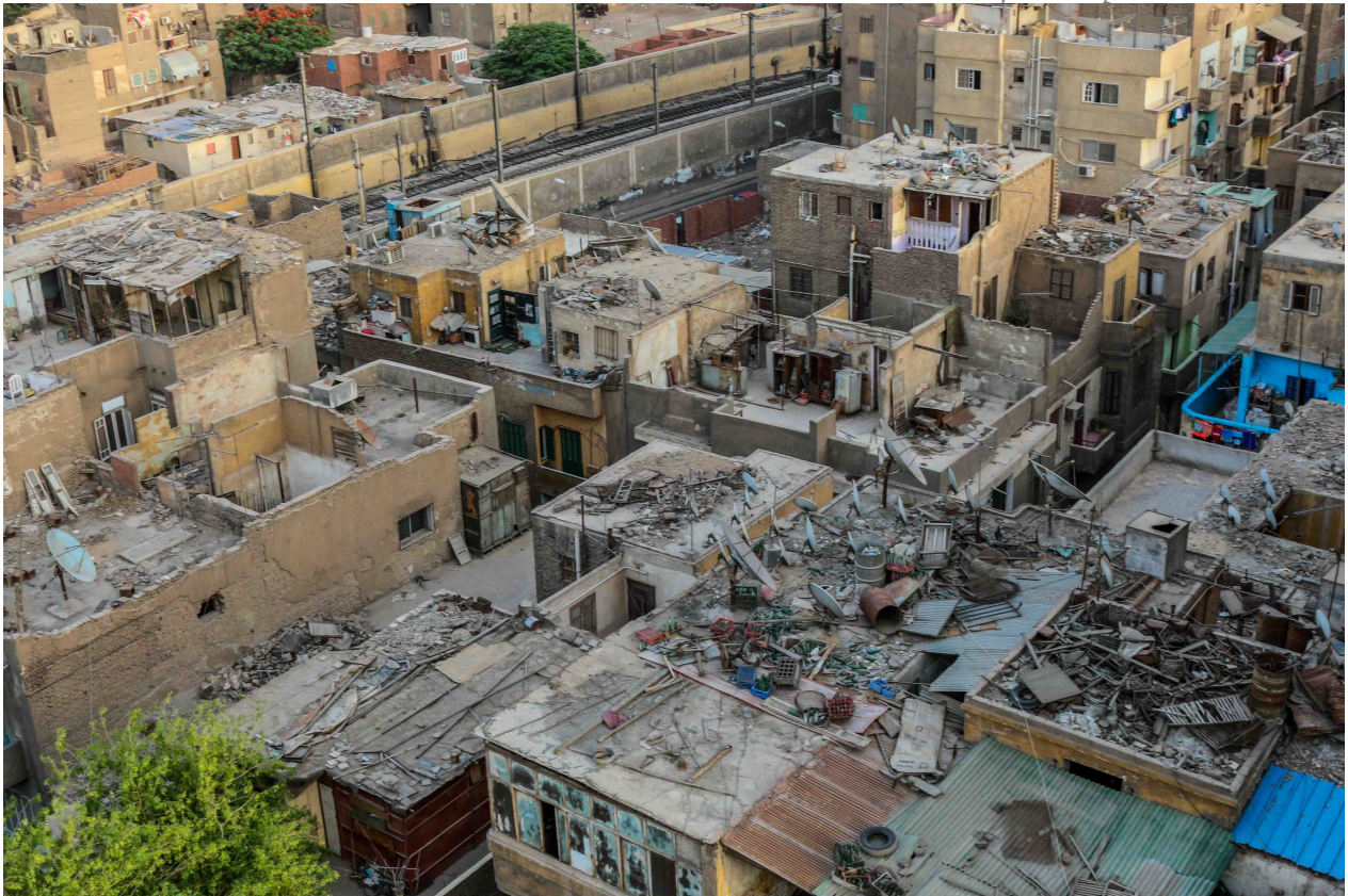
2. À Mounira, les habitants stockent ou entreposent des débris sur les toits pour ne pas avoir à payer pour leur évacuation. Ces actions participent involontairement à l'isolation thermique du dernier étage.

Cette enquête s'ancre dans le cadre de ma thèse qui porte sur les toits terrasses au Caire comme révélateur de pratiques d'adaptation des cairotes et de dynamiques urbaines, c'est-à-dire de la corrélation entre les usages qui sont faits de ces espaces et les évolutions socio-démographiques des quartiers où ils se situent. Le toit est un objet d'étude, largement laissé de côté dans ses dimensions sociales et géographiques, qui permet de développer une approche verticale de la ville. Un premier terrain exploratoire a été initié via une enquête photographique documentaire préalable à ma thèse (2016-2017). J'ai par la suite poursuivi ce terrain entre février et mai 2018, dans neuf quartiers de la métropole égyptienne. Les villes nouvelles n'ont pour l'heure pas été investiguées, à l'exception d'un toit à Obour City.