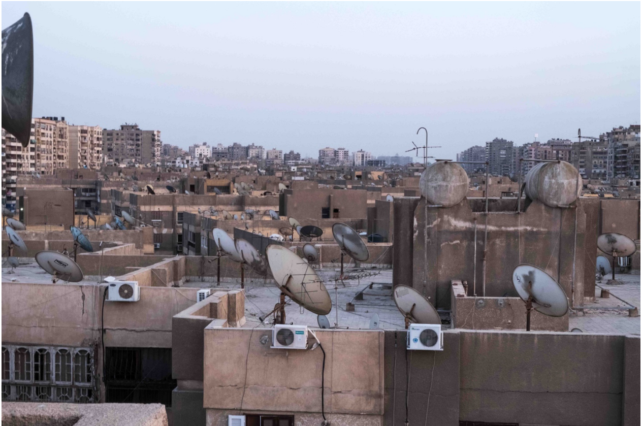
1. Toits de Nasr City, au nord-est du Caire. En fonction de leur orientation, les paraboles captent notamment les chaînes satellitaires américaines ou saoudiennes. (Marie Piessat, avril 2018)

Dans ce contexte de forte pression démographique, des « manières populaires d’habiter le territoire » (Mahmoud et Abd Elrahman, 2014) apparaissent, et pour faire face au manque d’espace, de nouveaux lieux sont investis, comme les toits-terrasses. Servant généralement de débarras et utilisés pour installer les paraboles satellites reliant l’immeuble au monde, ils se distinguent par leur malléabilité, c’est-à-dire leur capacité à s’adapter aux besoins de leurs usagers en fonction des situations. Dans le reste de la région, ces lieux restent seulement vus comme des espaces de socialisation réservés aux femmes, aux tâches domestiques et pouvant servir de dortoirs l’été (Fathy, 1966 ; Hadjri, 1993 ; Paquot, 2003 ; Kurzac-Souali, 2013). La question de la qualification de ces espaces en tant que ressource spatiale à l’échelle de la ville mérite donc d’être posée. On considère la ressource comme « la mise en valeur d’un capital, [...] exploité par une société donnée à un moment donné dans le but de créer des richesses » ( Géocofluences , 2010).