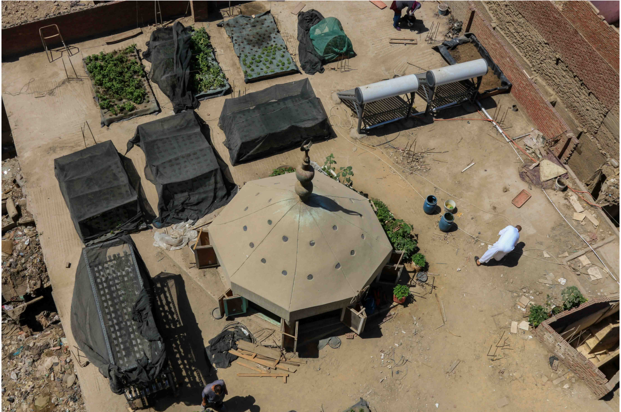
9. Ferme hydroponique installée sur le toit d'une mosquée à el-Bassatin. La ferme a été financée par une levée de fonds privés et mis en place par l'entreprise Schaduf qui promeut l'usage des toits à des fins agricoles. Les récoltes tirées de cette ferme sont distribués aux personnes sans logement du quartier (Marie Piessat, mai 2017).