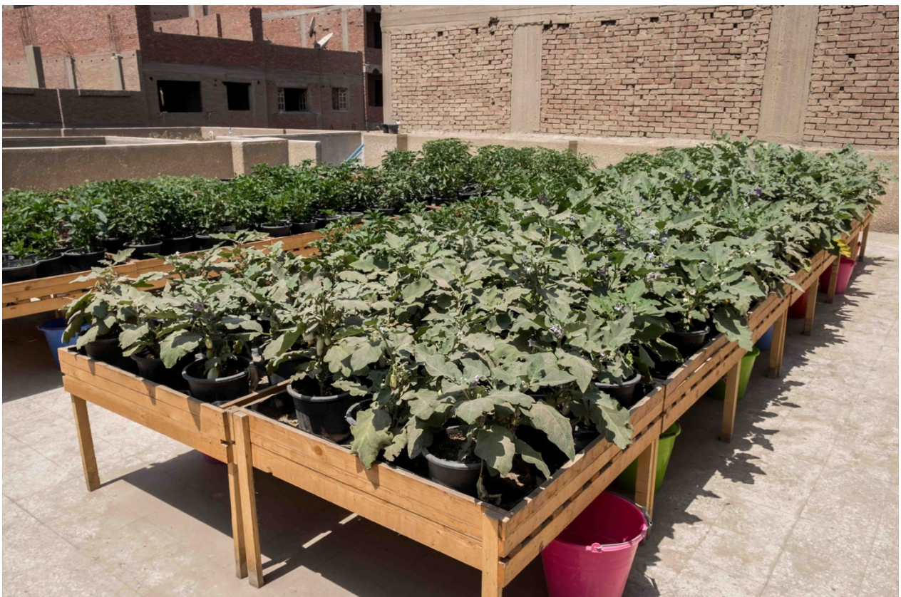
10. Ferme hydroponique sur le toit de l'école EDAM (Environment Development Association Moytamadeia), installée par l'entreprise al-Bostani, dans le quartier d'Ard el-Lewa (Marie Piessat, avril 2018).