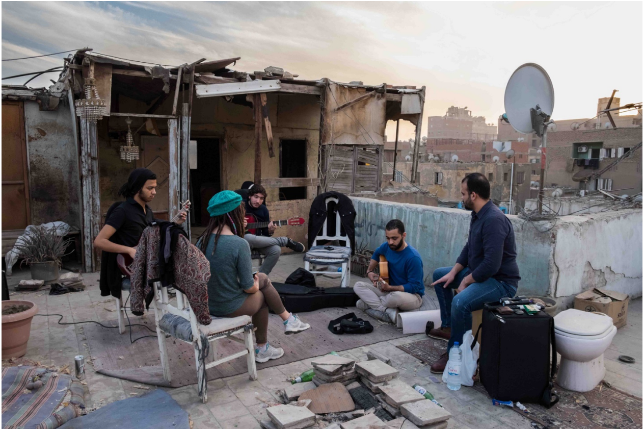
14. Le groupe de musique Sol Dièse répète sur le toit de l'immeuble d'un de leurs membres, dans le quartier de Mounira. C'est le seul endroit qu'ils ont trouvé pour travailler régulièrement sans incommoder personne (Marie Piessat, mars 2018).

L'un des loisirs les plus en vogue sur les toits de la capitale, mais également dans le reste du pays, sont les compétitions de pigeons. Chaque jour à la tombée du jour, les colombophiles font voler les oiseaux qu'ils ont dressé à reconnaître un son particulier. Éleveurs et compétiteurs sont les mêmes, mais les oiseaux diffèrent, tout comme le soin qui leur est apporté, selon qu'ils soient destinés au jeu ou à la consommation. Lors d'une compétition, l'objectif est d'attirer les pigeons d'un voisin afin de les lui chaparder. Il existe diverses variantes de ce jeu. En s'occupant quotidiennement de leurs pigeons, les colombophiles s'arrangent des moments de détente où ils se déconnectent de leurs soucis quotidiens. Pour beaucoup, ces moments privilégiés sont une source relaxation précieuse. Cette activité demande un investissement de temps important et est généralement pratiquée par de jeunes hommes célibataires ou des hommes mûrs, n'ayant plus d'enfants à charge.