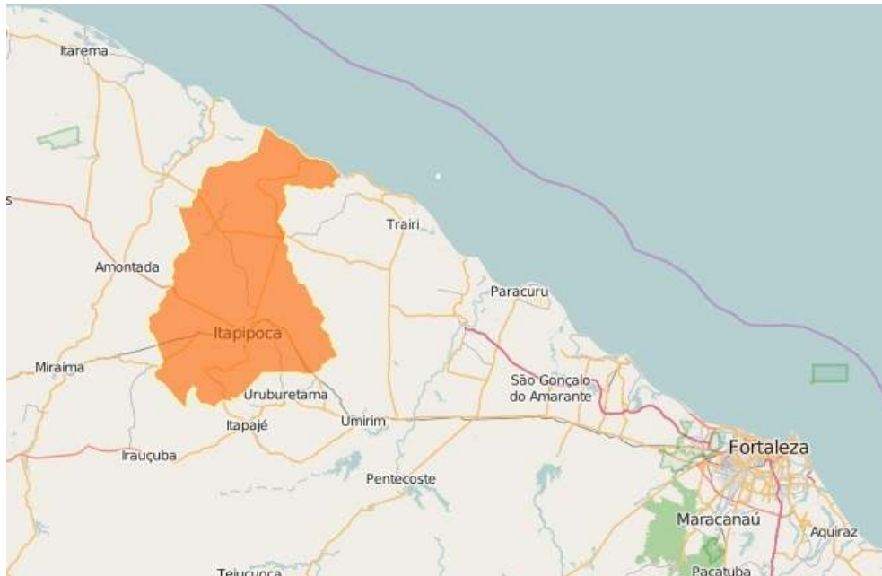
Figure 1 : Municipalité d'Itapipoca, Ceará

source : IBGE (Institut Brésilien de Géographie et Statistiques), 2016