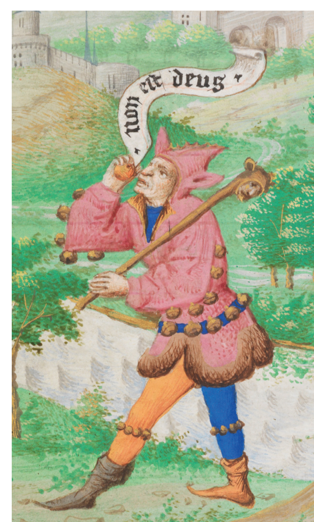
Carmina Burana. Codex Buranus (2009) CLEMENCE CONGONI Carmina Burana. Codex Buranus. Original version.