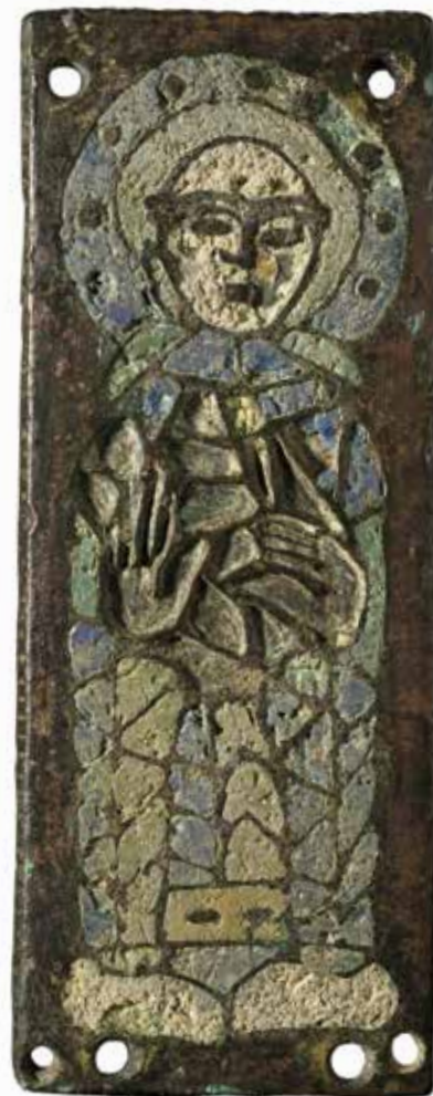
Moine tenant un livre, XI e siècle, plaque émaillée, musée Sainte-Croix.

MELLEBAUDE, UN ABBAS MÉROVINGIEN Au musée Sainte-Croix de Poitiers, un nouvel espace intitulé «D'un empire à l'autre. Premiers temps chrétiens en Poitou, IV e -IX e siècle» permet d'admirer les pièces sculptées provenant de l'hypogée des Dunes, choisi par Mellebaude, abbas mérovingien, pour y établir sa sépulture.