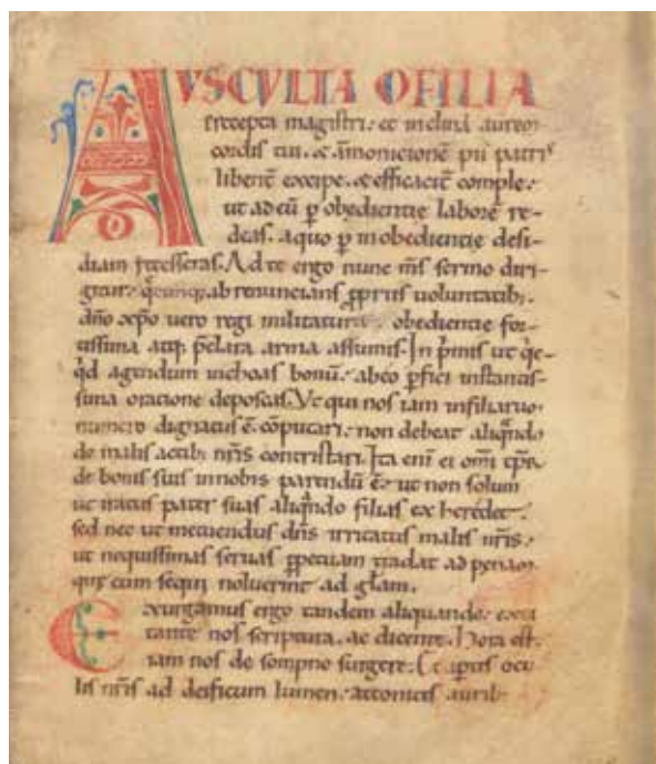
Règle bénédictine pour les femmes (abbaye aux Dames de Saintes), XII e siècle. Yale University, Beinecke Library, ms Marston 25, 129 o .

À ce titre, on ne peut s'empêcher de considérer comme miraculeuse la conservation de documents remontant, parfois, à plus de mille ans. Tant de choses ont en effet péri de ce que les moines ont écrit. Cependant, la moisson peut être fructueuse si l'on s'arme de patience et de persévérance pour retrouver les manuscrits provenant des abbayes de la région. Et quelle émotion de contempler à la médiathèque de Poitiers l'évangélaire de Sainte-Croix ou de tenir dans ses mains aux archives de Limoges un véritable diplôme de l'empereur Louis le Pieux, du début du IX e siècle ; quelle chance de pouvoir feuilleter la somptueuse bible enluminée de Saint-Yrieix conservée à la bibliothèque municipale du lieu, même si elle n'est «que» du XII e siècle.