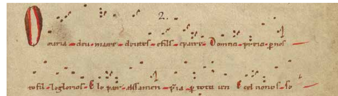
O maria deu maire, Paris BnF ms latin 1139, f. 4r, détail.

Les offices votifs de la Vierge (XIII e ) et les proses ou offices des Joies de la Vierge (XII e ) qui complètent la fin du volume suggère aussi une forte dévotion mariale, dévotion en plein essor à cette époque comme le montrent bon nombre de pièces en latin ou en langues vernaculaires. ■