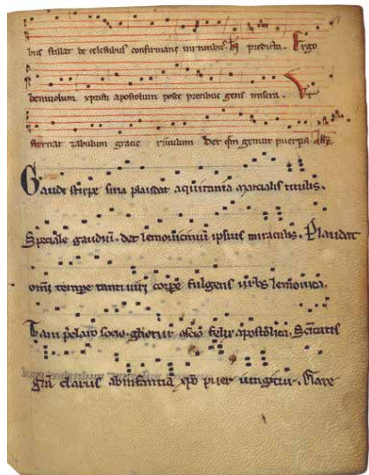
BnF ms. latin 1139, f. 49r.

Le manuscrit latin 1139 conservé à la BnF témoigne des pratiques musicales de l'abbaye Saint-Martial à Limoges au Moyen Âge.