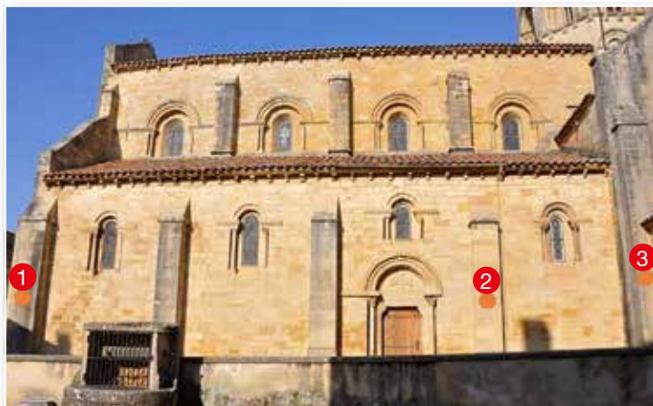
La collégiale Saint-Hilaire de Semur-en-Brionnais. Les ronds rouge indiquent l'emplacement des trois cadrans solaires.