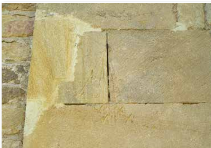
Le cadran solaire de l'église de Fleury-la-Montagne, mur est de la travée de chœur.

sol. Il est gravé sur trois pierres, et le gnomon, qui a disparu, était fiché dans un joint de lit. Treize rayons irradiant de ce point et, à chaque rayon, correspond un chiffre romain.