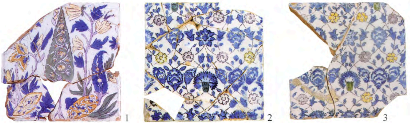
Pl. VI 1-3, Marseille, dépôt archéologique.