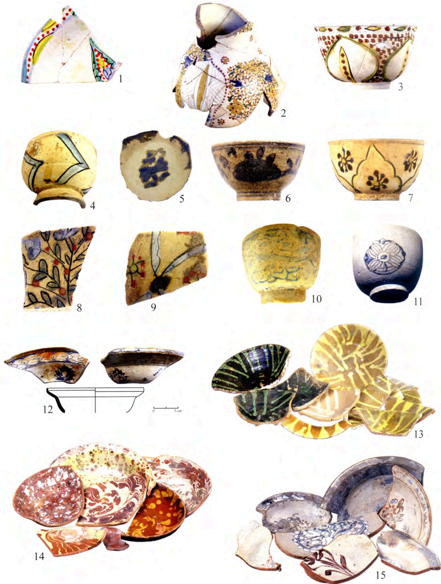
Pl. II 1, Marseille, Place Bargemon ; 2, Pourrières, Verrerie de Roquefeuille ; 3-11, Marseille, Port de Pomègues, 12, Rade de Villefranche, palais de la Marine, 13-15, Marseille, Port de Pomègues.