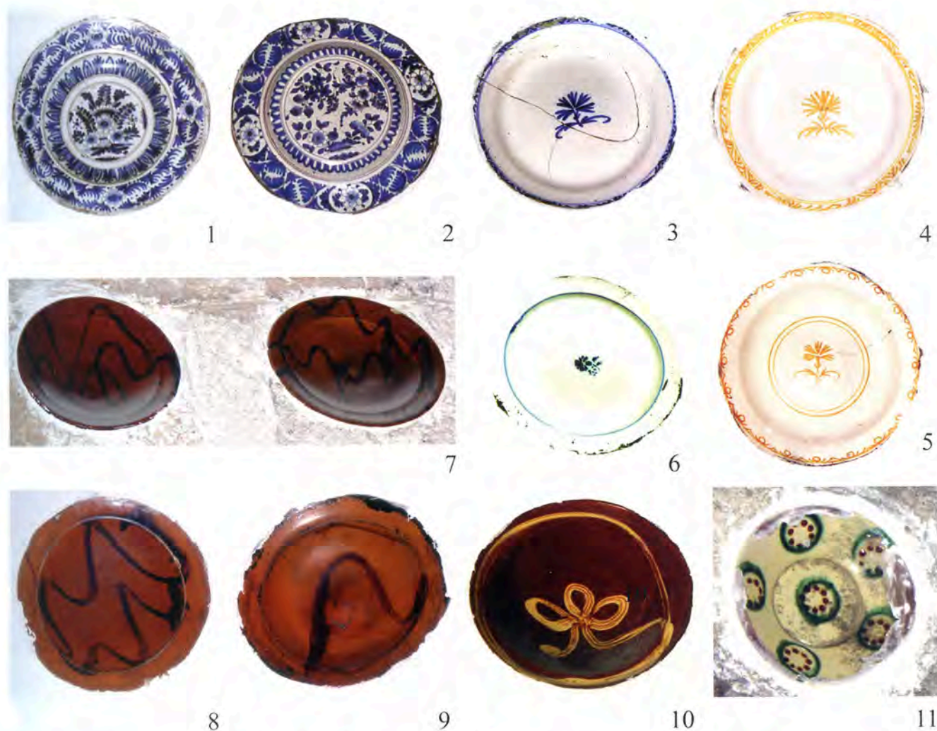
Pl. V Chypre, Nicosie, 1-6, 8-9 ; églises de Kaïmakli ; 7, 10, 11 Paralimni.

Le Sérail n'est pas le seul endroit où l'on ait eu recours à ces revêtements émaillés d'une esthétique très différente du goût ottoman. On en retrouve également la trace, à la Mosquée d'Eyup, toujours à Istanbul,