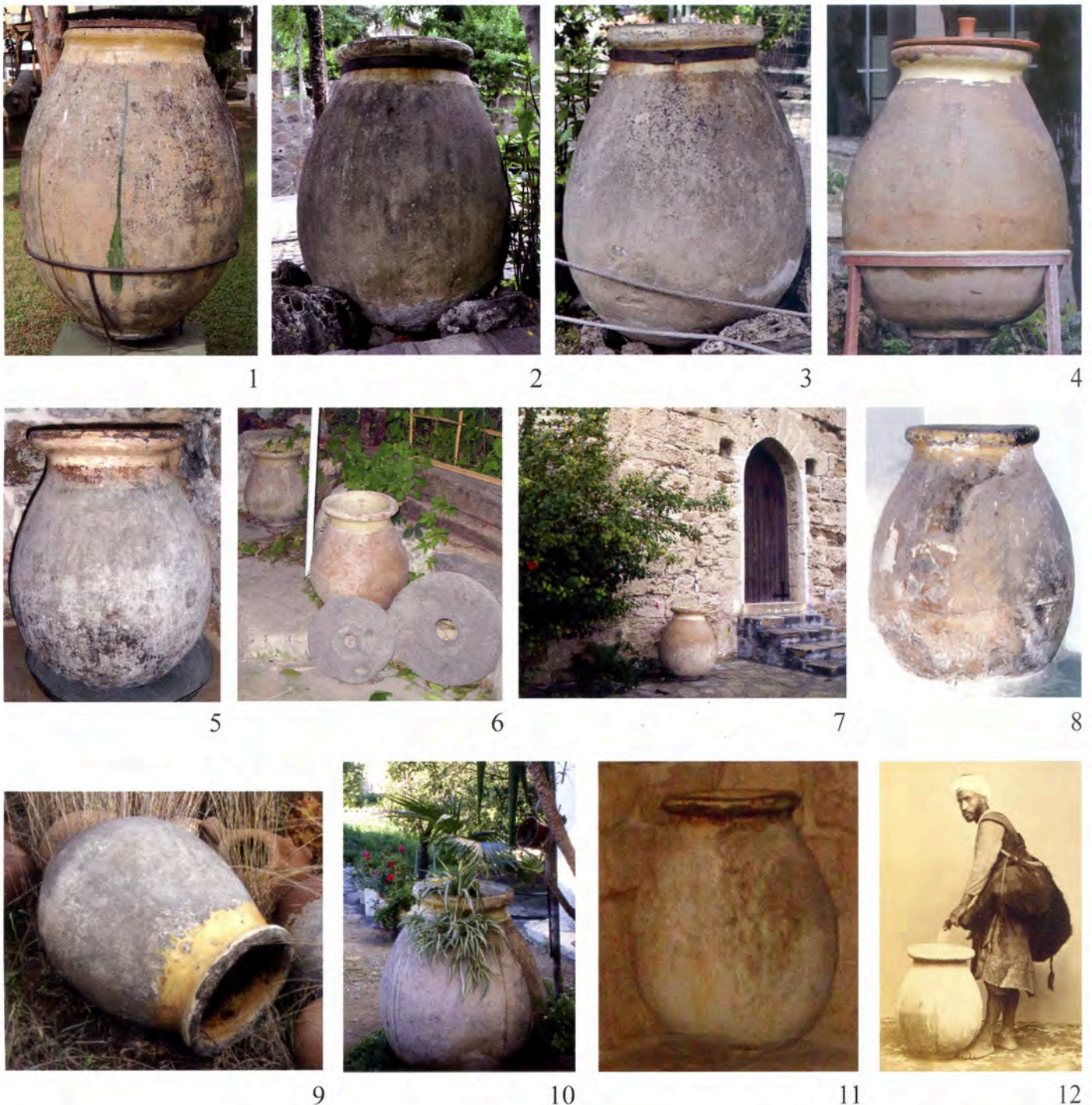
Pl. VII 1, Turquie, musée d'Alanya ; 2-3, musée d'Izmir ; 4, musée d'Antalya ; 5, Syrie, couvent Saint-Georges ; 6, Syrie, moulin à Safita ; 7, Chypre, Kyrenia ; 8, Nicosie, Hadji Georjakis ; 9, Chypre, Mosphiloti ; 10, Chypre, Dali ; 11, Liban, Saïda, musée du savon ; 12, Egypte, Alexandrie, porteur d'eau.