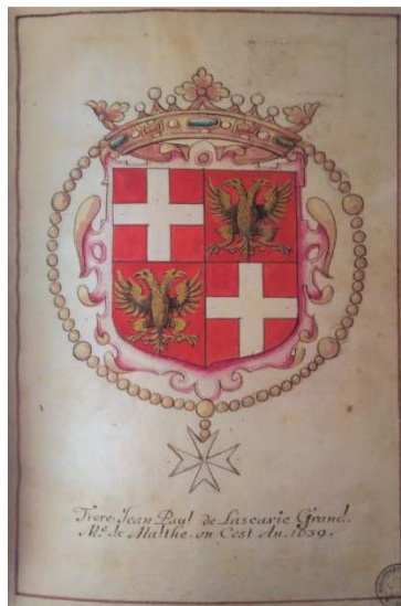
5. Armoiries de Jean-Paul de Lascaris, grand maître de l'ordre de Malte (Noms, surnoms et armes de tous les grands maistres de Malthe, 1639, BnF, Bibliothèque de l'Arsenal, ms. 5266).

Une page de titre peinte ouvre le recueil : il s'agit d'un encadrement présentant le thème traité à la gouache dans des couleurs vives. 57 armoiries sont ensuite présentées – quelques-unes sont toutefois laissées vides, en l'absence de données sur les armes du titulaire. Les 1 et 4 de l'écartelé se présentent néanmoins comme de gueules à la croix d'argent, comme tous les grands maîtres de Malte. Les trois derniers écus sont laissés blancs en l'attente de la nomination des successeurs du maître d'alors, Jean-Paul de Lascaris 36 . Ce premier recueil se clôt sur les armes – entièrement peintes cette fois-ci – du Grand Maître d'alors, avec couronne et collier de l'ordre ( fig. 5 ).