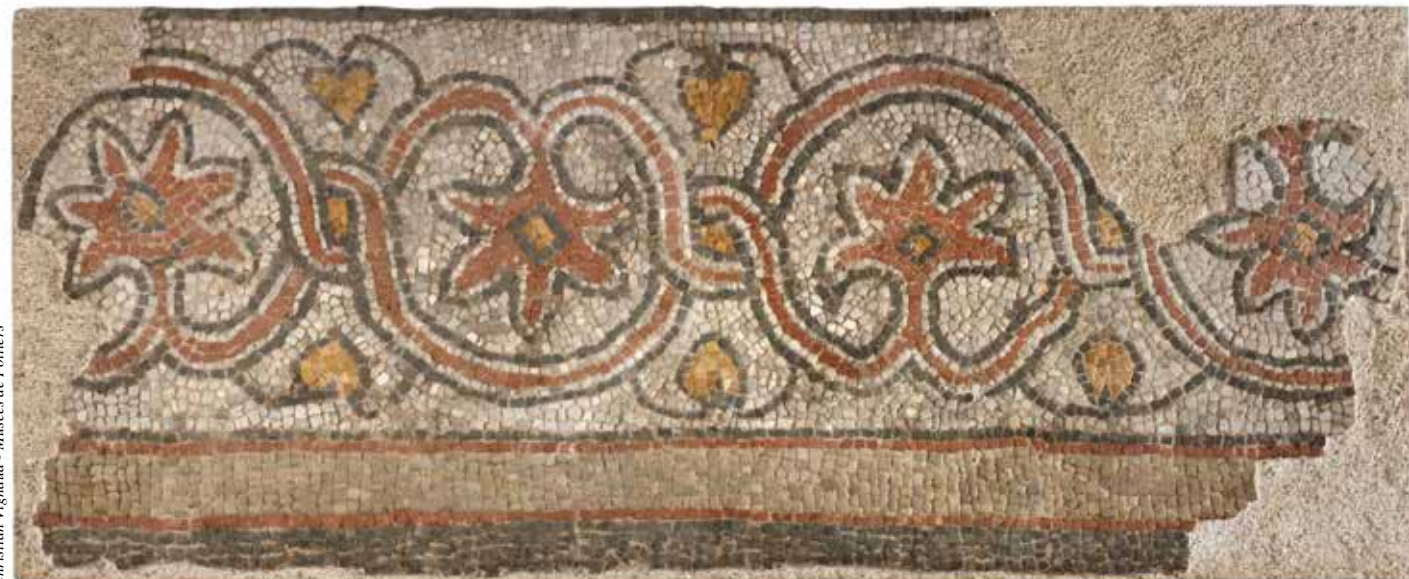
Christian Vignaud - Musées de Poitiers