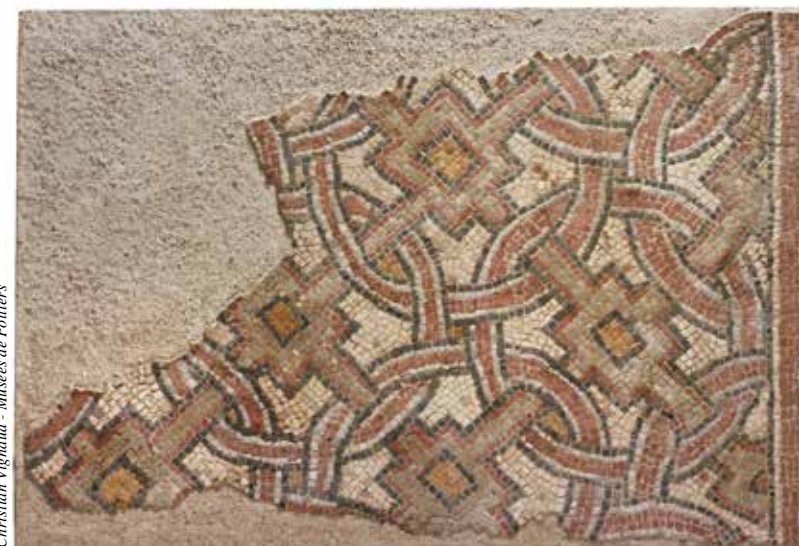
Christian Vignaud - Musées de Poitiers