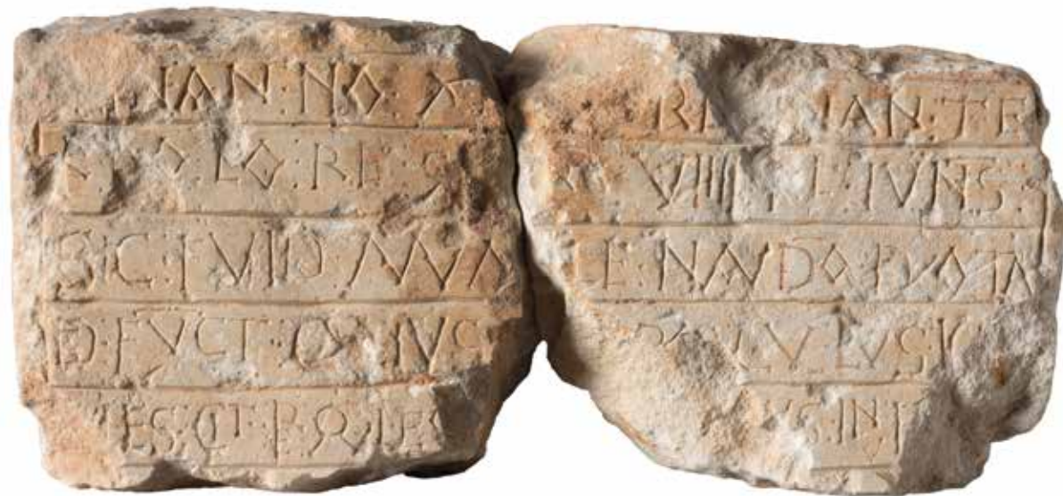
Christian Vignaud - Musées de Poitiers