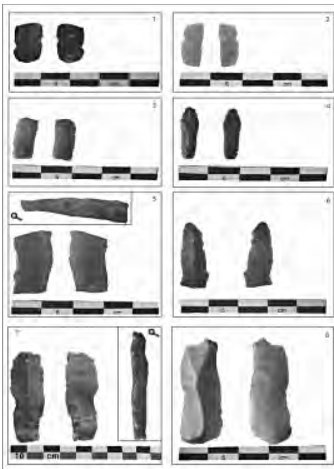
Fig. 1 : BONGHEAT – Les Côtes : matériel lithique recueilli en prospection 1, 2, 3, 4 et 6 : lamelles 5 : fragment de lame retouchée 7 : lame retouchée 8 : lame