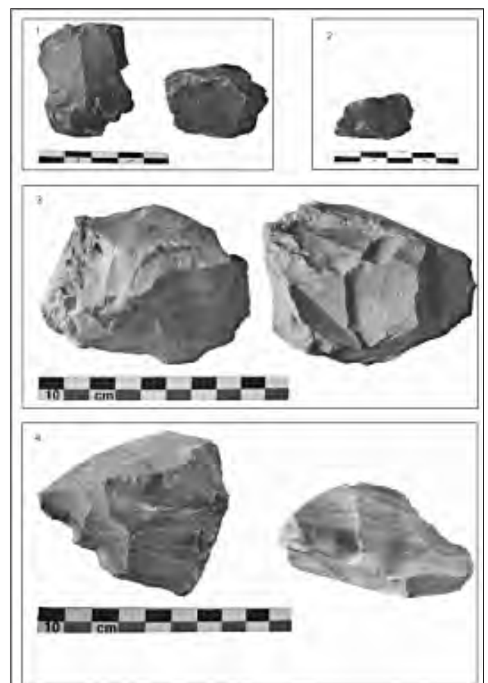
Fig. 2 : ÉGLISENEUVE-PRÈS-BILLOM – Champlong : matériel lithique recueilli en prospection 1, 3 et 4 : nucléus à lames 2 : nucléus à lamelles