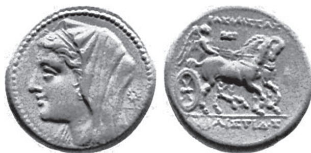
Figure 5 Philistis. Drachme « lourde ». SNG VII 544, Manchester University Museum..

Les droits figurent tous le portrait d'une femme, probablement Philistis, ce qui est là encore une originalité de ces monnayages. Les portraits de femmes sont en effet très peu présents sur les monnayages grecs en comparaison de ceux des déesses, ce qui