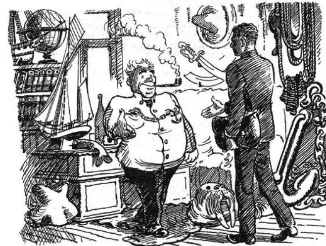
«Очень приятно познакомиться. Капитан дальнего плавания Врунгель Христофор Бонифатьевич, — произнес он громовым басом, протягивая мне руку»

Сам факт того, что рассказ излагается ученику Врунгелем напрямую, свидетельствует, по мнению рассказчика, о несомненной правдоподобности излагаемого. Здесь и далее подобные выводы-аксиомы как бы размывают границы между реальным изображением картины и бесконечной чередой рассказней, не позволяя