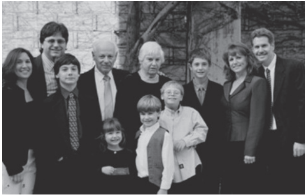
Fig. 5a-b Author and offspring (silhouette of some grandchildren behind) Budapest 2011 • The Faludi-Danieli clan Los Angeles 2008

the, so far mainly verbal, attacks, partly by the contemporary trend to search for 'roots', young (and not so young) people tend to identify themselves as Jews. Not Zionists, though. But there is an annual, well-advertized and -attended Jewish Festival with major names of performers and of a high quality. Sometimes neo-Nazis demonstrate. With the election victory of a right-wing party and its tacit allies of open populist and Anti-Semitic position (the so called 'Jobbik', playing on the homophone 'better' and 'right') these racist tones are becoming louder and, in response, fear and alienation of assimilated Jews (as the majority of non-assimilated Orthodox were murdered in the Holocaust!) is increasing. Failure of the project? It can't happen here?