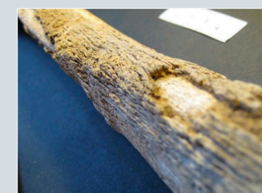
Fig. 7 - Conséquence des infections ascendantes et des ulcères des extrémités provoqués par la perte de la sensibilité, les appositions périostées, fréquentes et importantes à Aizier, apparaissent sous forme de reliefs plus ou moins épais autour des diaphyses des tibias et fibulas.