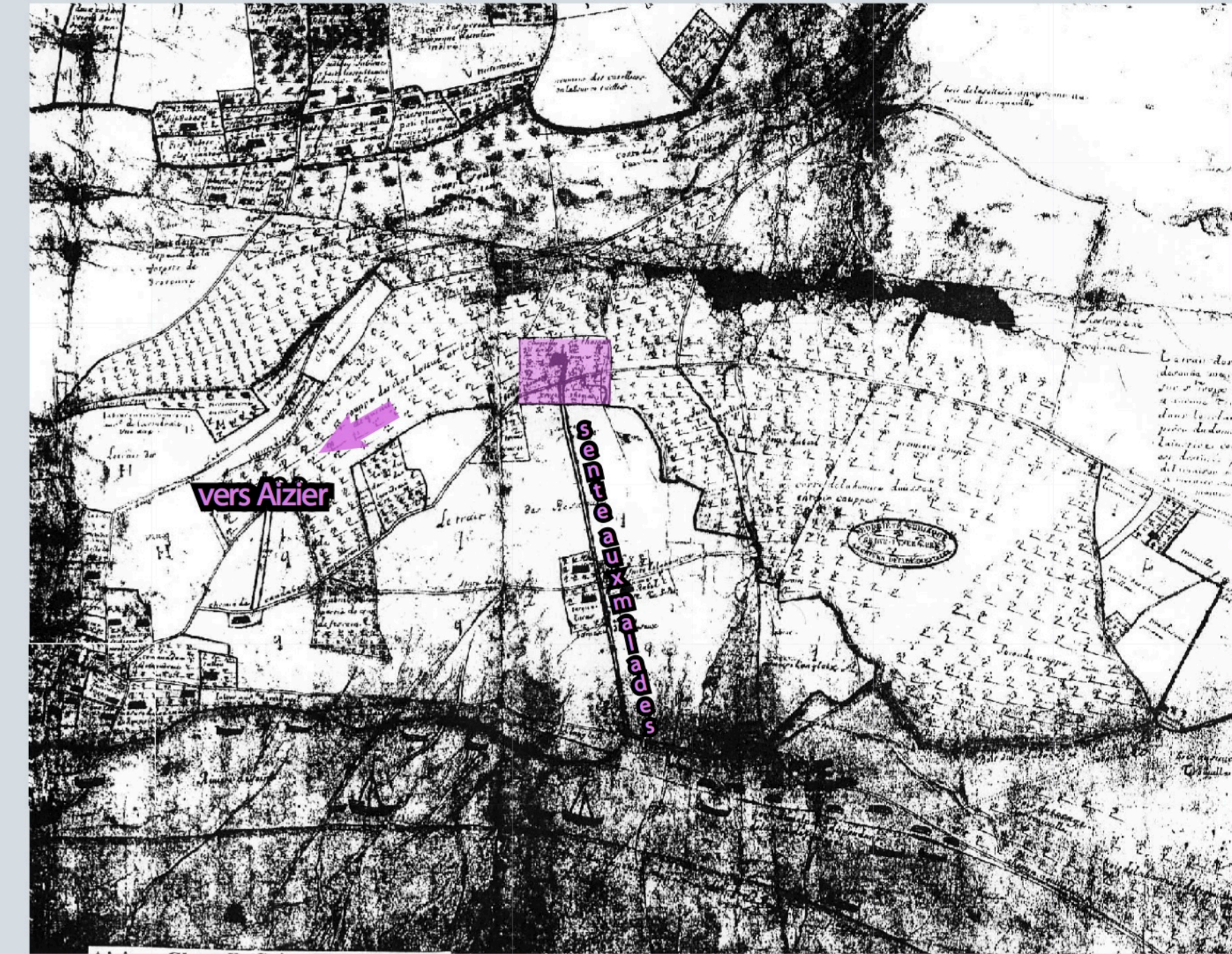
Fig. 2 - Localisation de la chapelle Saint-Thomas d'Aizier sur un plan terrier du XVII e s. (ADSM, terrier 296 1697 ; Cliché : B. Penna, GAVS).

Mentionnée dans les sources écrites à partir de la fin du XII e s., la léproserie d'Aizier est désaffectée au cours du XVI e siècle (fig. 2).