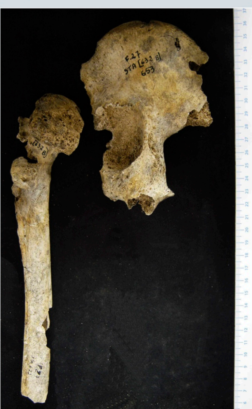
Fig. 9 - Pathologies congénitales et malformations des membres inférieurs sont ces également présentes en sus des atteintes lépromateuses.