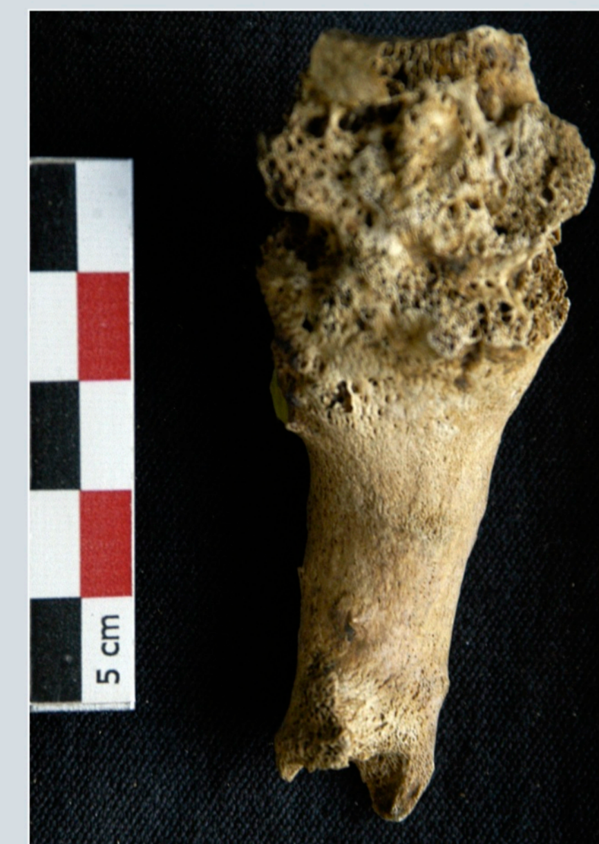
Fig. 5 - Les ulcérations torpides provoquent des attaques bactériennes ubiquitaires des os du tarse ou ostéite, à l'origine de destructions, de déformations et d'ankyloses (Cliché : J. Blondiaux, CEPN-CRAHAM).