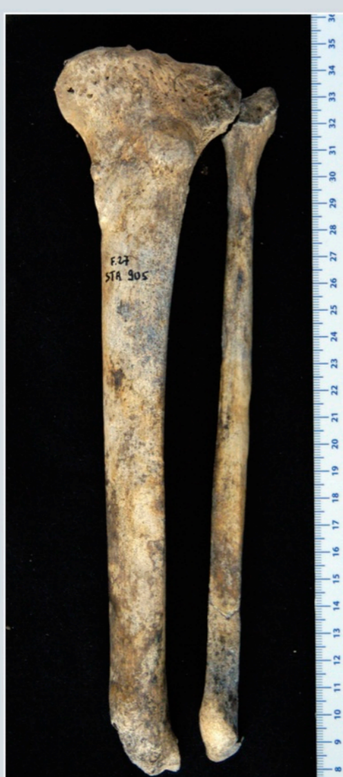
Fig. 10 - Amputation des os de la jambe en lien avec la destruction des os du pied au cours de la maladie.