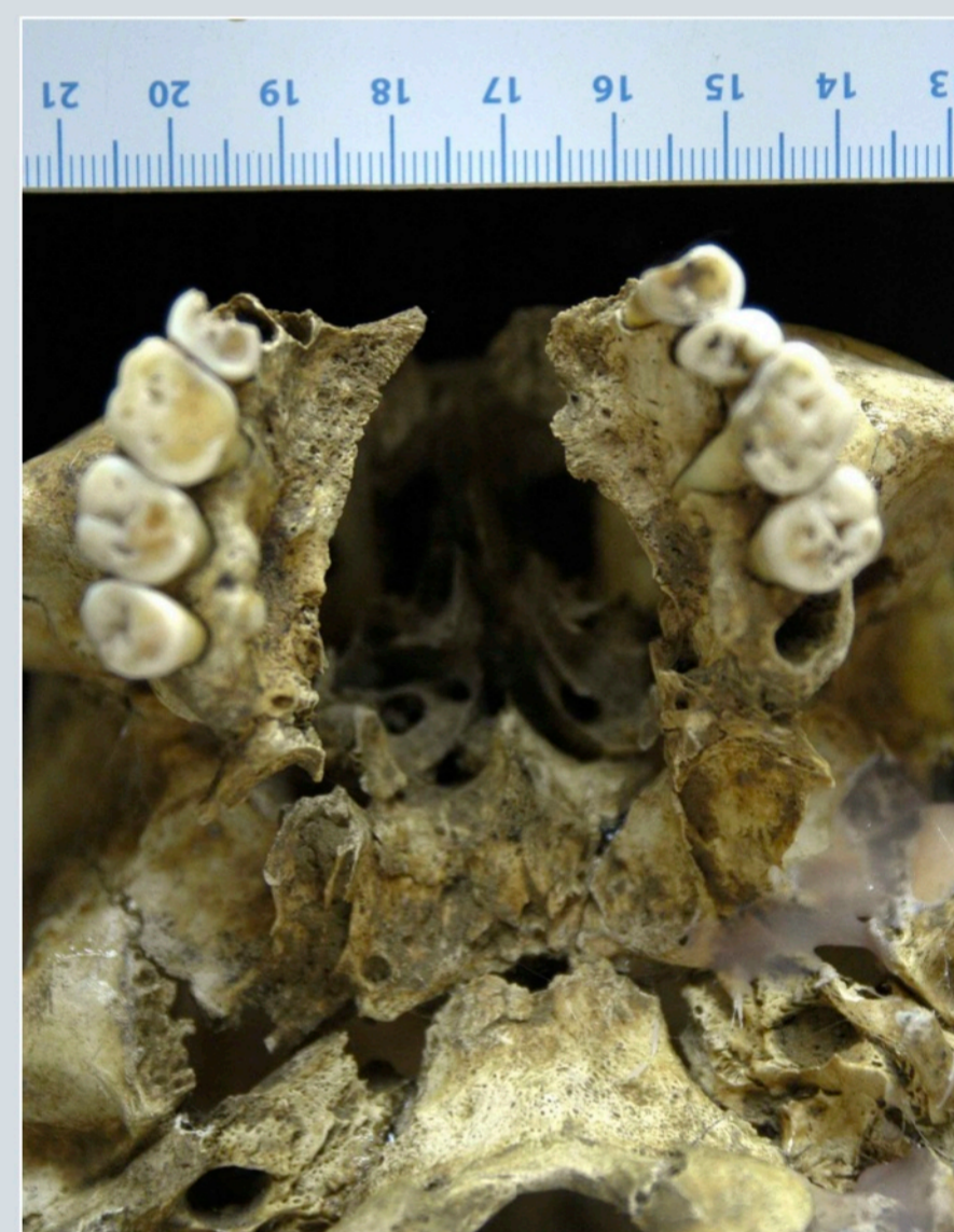
Fig. 4 - Syndrome rhino-maxillaire : l'élargissement du foramen piriforme du nez, l'érosion du massif maxillaire antérieur qui met à nu les racines des incisives sont les conséquence de l'action destructive directe du mycobacterium leprae sur les os de la face. A Saint-Thomas d'Aizier, pour la majorité des crânes conservés, ces lésions, typiques de la lèpre lépromateuse, sont présentes.