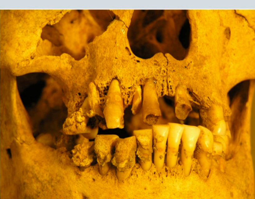
Fig. 11 - Importance du tartre et des atteintes bucco-dentaires.