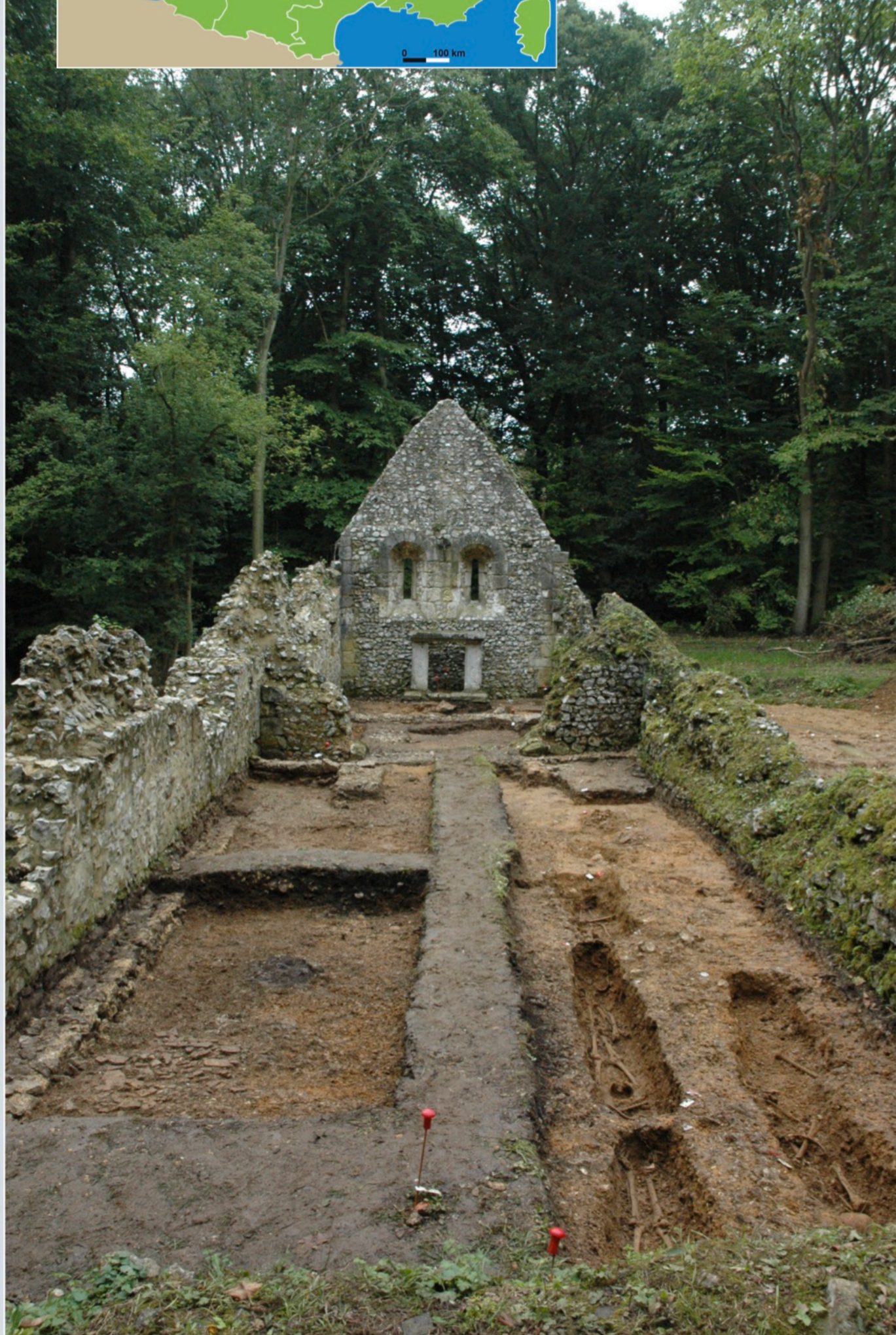
Fig. 1 - Chapelle Saint-Thomas d'Aizier en cours de fouille.