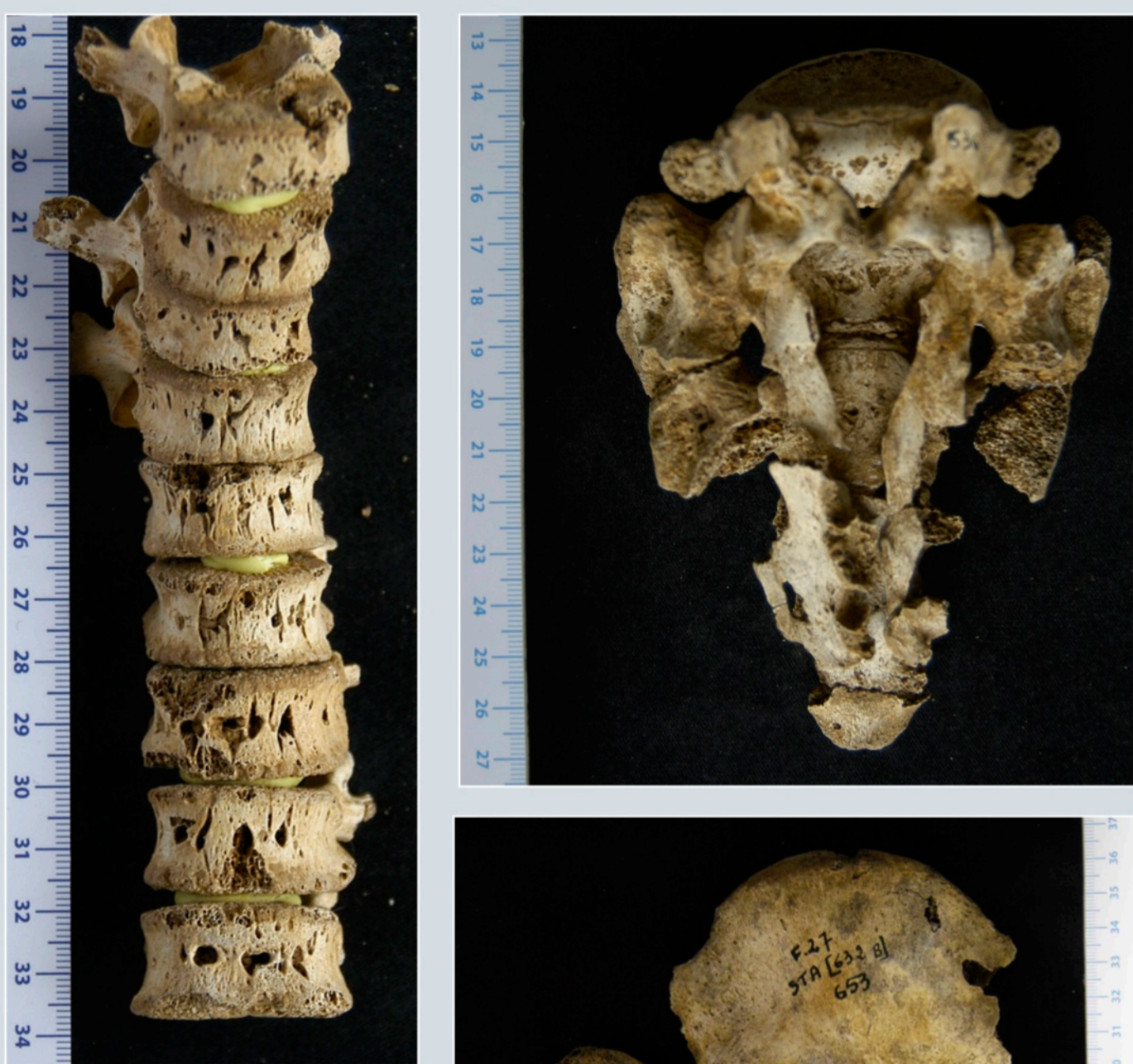
Fig. 8 - Plusieurs individus comportent des marques d'appositions périostées des côtes et un jeune est décédé avec des lésions caractéristiques de la tuberculose sur le rachis (SP. 642).