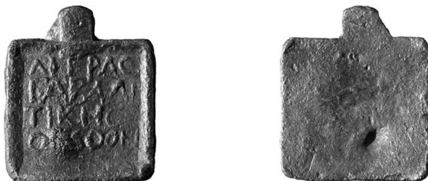
Fig. 1. Poids d'un huitième de livre. Échelle ca. 1:1