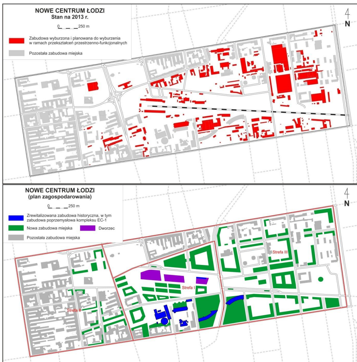
Rys. 3. Przekształcenia przestrzenne w kwartałach śródmiejskiej objętych projektem „Nowe Centrum Łodzi”. Źródło: Kazimierzczak (2014a)

W roku 2007 Rada Miasta podjęła uchwałę o odnowie obszaru przemysłowego wzdłuż linii kolejowej prowadzącej do dworca kolejowego Łódź Fabryczna. W ramach wielkoskalowego projektu pod nazwą „Nowe Centrum Łodzi” o powierzchni 100 ha został wybudowany podziemny dworzec kolejowo-autobusowy, natomiast tereny ponad tunelem i dworcem w kwartałach ograniczonych ulicami Piotrkowską, Narutowicza, Kopcińskiego i Tuwima są przeznaczone pod nową zabudowę o zróżnicowanych funkcjach z dominacją usług (47%) i terenów mieszkaniowych (12%). W ramach prowadzonych działań rewitalizacyjnych planowane są liczne prace rozbiórkowe finansowane z środków publicznych, co ma zwiększyć atrakcyjność inwestycyjną tej części miasta. Zgodnie z planami przebudowy w części centralnej (strefa I) oraz