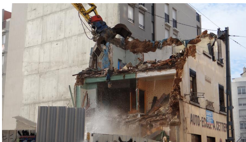
Foto 1: Demolowanie bez preparacji budynku dla segregacji odpadów– Villeurbanne, L. Mongeard, 2013

Dzisiaj stosowana praktyka dekonstrukcji przebiega w ściśle określony odpowiednimi procedurami sposób, polega przede wszystkim na oczyszczeniu budynku poprzez usunięcie niebezpiecznych elementów (ołów, azbest), a następnie zastępowanie ich innymi bezpiecznymi materiałami wykończeniowymi. Ma miejsce również celowe obniżenie struktur poprzez zmniejszenie liczby kondygnacji (demontaż) (foto 2). W efekcie operacji rozbiórkowych i wyburzeniowych powstają trzy rodzaje odpadów segregowanych według stopnia szkodliwości a mianowicie: niebezpieczne, nie obojętne, bezpieczne i obojętne.