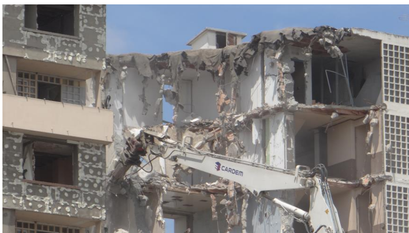
Foto 2 : Dekonstrukcja szczypcem struktury betonowej po usunięciu materiału wewnętrznego - Lyon, L. Mongeard, 2013

Są one oddzielane od siebie, oznaczane odpowiednio i następnie traktowane w różny sposób i przy ewentualnym ponownym wykorzystaniu. Tym samym funkcjonowanie sektora profesjonalnego powiązanego z procesem demolowania jest ważnym zagadnieniem, ponieważ kolejne etapy dekonstrukcji i relacje między rozbiórką a recyklingiem, pokazują, że technologia wyburzeń i rozbiórek może być częścią polityki "zrównoważonego miasta". Działania przeprowadzone w tym zakresie na terenie aglomeracji w Lyonie doskonale dokumentują znaczenie sektora budowlanego w procesie zarządzania odpadami wytwarzanymi podczas przekształcania miasta. Ponadto jak wskazuje praktyka powtórnie użycie odpadów rozbiórkowych ma również istotną wartość ekonomiczną (pośrednio obniża koszty prowadzonych inwestycji), i staje się w ten sposób w rzeczywistości najbardziej atrakcyjnym rozwiązaniem, często stosowanym. Skuteczność wprowadzenia tego typu postępowania do sektora budowlanego wynika po części także z faktu istnienia silnych, powiązań lokalnych społecznych i instytucjonalnych oraz z zastosowania odpowiednich rozwiązań organizacyjnych na obszarze miasta ale i regionu w Lyonie (np. utworzenie platform recyklingowych ułatwiających kontakty między interesariuszami tych działań).