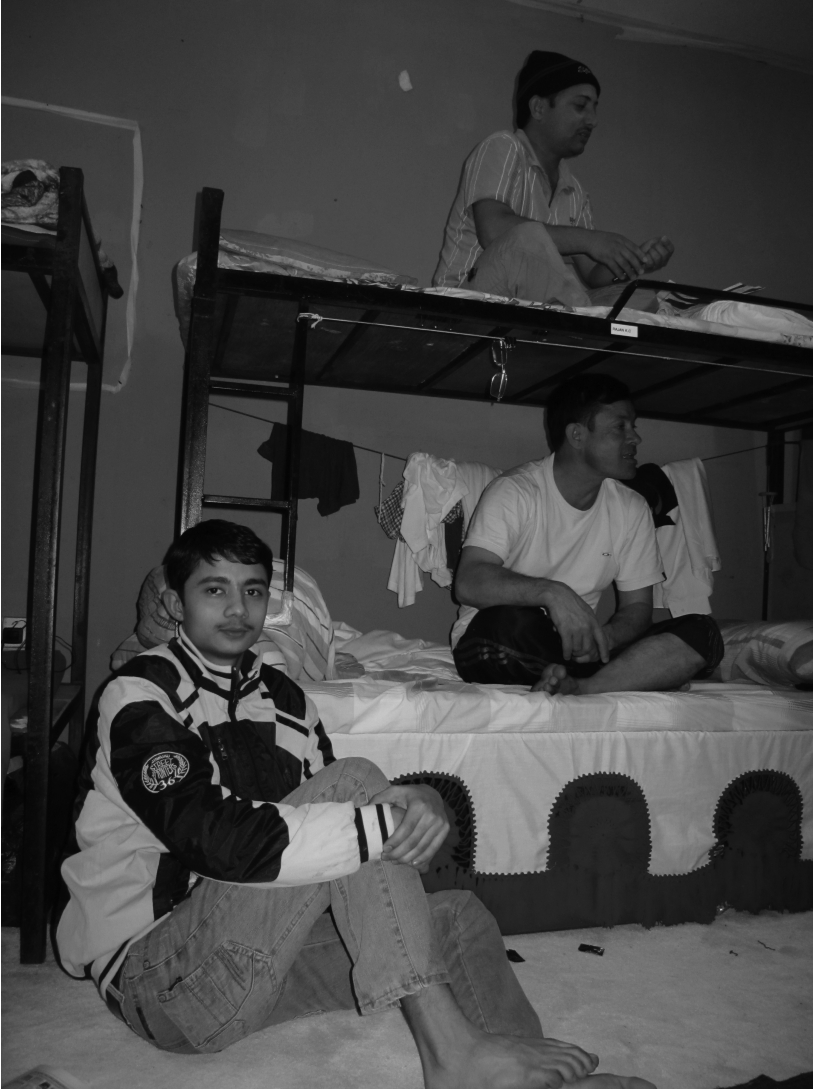
Photo 2 La verticalité pour gagner de l'espace (T. Bruslé) Verticality used to improve space management (T. Bruslé)

tout est prêt, les hommes s'installent alors par terre, posant leur assiette sur une feuille de papier journal. Les jambes en tailleurs, le repas se consomme de la main droite, et très rapidement. On laisse une assiette pour celui qui rentre plus tard. Le dortoir impersonnel, parenthèse dans la vie des hommes, devient un espace de partage – les ustensiles et la nourriture ont été achetés en commun – et prend des traits domestiques. Il se fait salle à manger avec cependant une différence