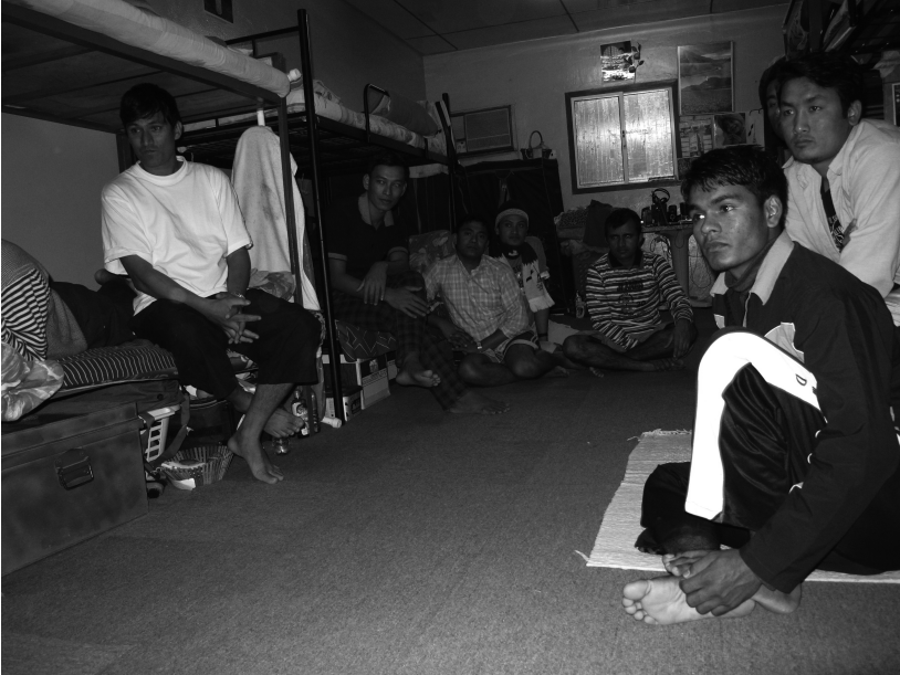
Photo 3 Un soir de coupe d'Asie de football (T. Bruslé) Watching the Asian football cup (T. Bruslé)

notoire par rapport au Népal rural : toutes les castes mangent ensemble 27 . Il n'en reste pas moins que l'ambiance fait penser à une atmosphère de commensalité népalaise. Pendant que les dernières productions cinématographiques népalaises tournent en boucle sur les ordinateurs ou à la télévision, les hommes dégustent le plat national parfois agrémenté de beurre clarifié rapporté du village par l'un d'eux. Dans une zone industrielle qatarienne, le dortoir d'un camp devient un univers domestique népalais, où la nourriture prend une place de choix.