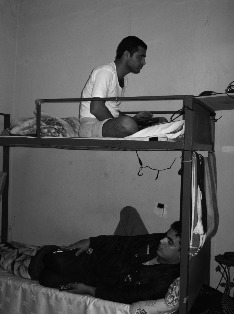
Photo 1 Le bricolage au service des nouvelles technologies (T. Bruslé) Do-it-yourself technologies assisting new technologies (T. Bruslé)

aux tons vifs, l'est plus. D'une manière générale, les murs collectifs, au sens où le regard n'est pas bloqué par un lit ou par la niche que forme le lit inférieur, sont peu décorés. Dans toutes les chambres, deux objets sont néanmoins présents.