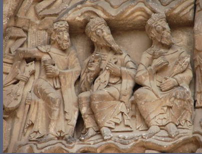
Tympan de l'abbaye de Moissac XIIe siècle