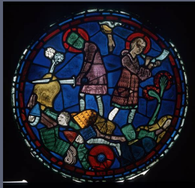
Cathédrale de Chartres 1/4 XIIIe siècle