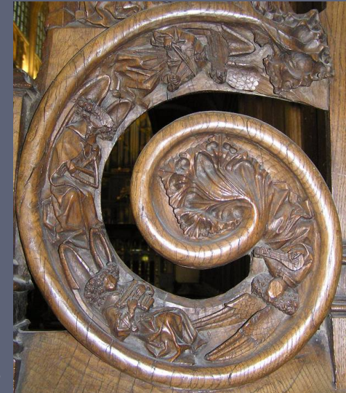
Jouée de stalles XVIe siècle