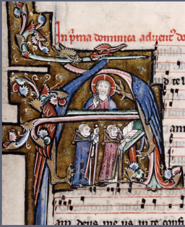
Arras, ms. 888 XIIIe siècle