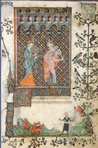
Avignon, ms. 121 XIVe siècle