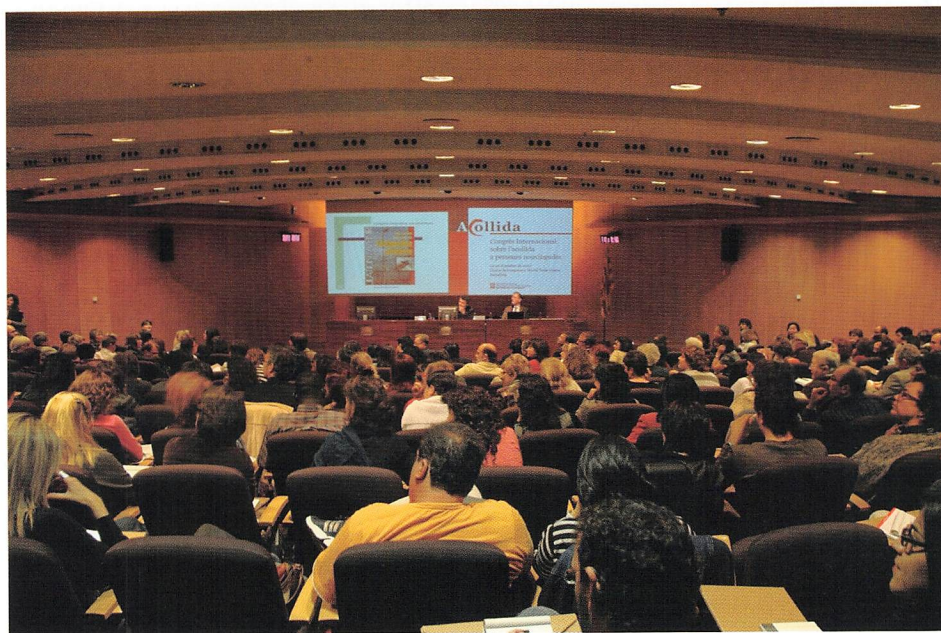
■ L'auditori del World Trade Center de Barcelona ple de gom a gom durant la inauguració del Congrés.