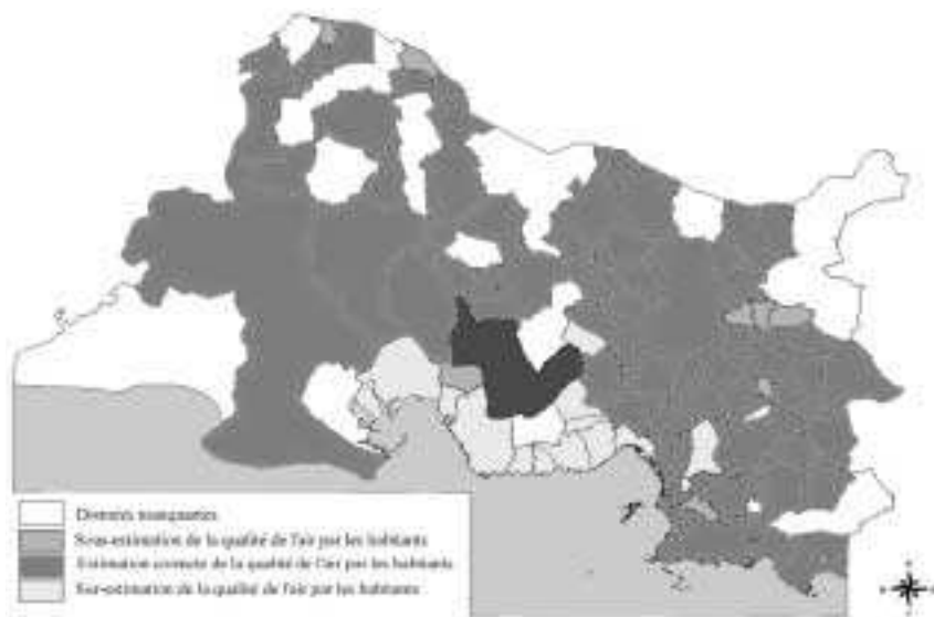
Figure 2. Écart entre qualité de l'air mesurée et qualité de l'air perçue par les habitants des communes du département*

* Les données manquantes indiquent une absence de répondants dans cette commune.