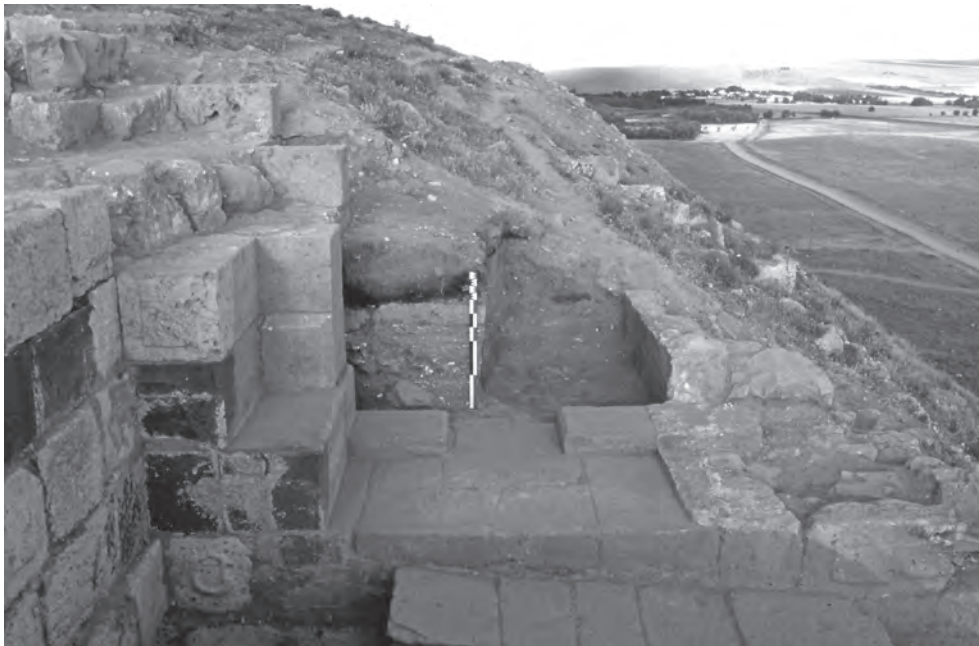
FIGURE 5 : LA PORTE MONUMENTALE DE LA CITADELLE EN COURS DE DÉGAGEMENT.