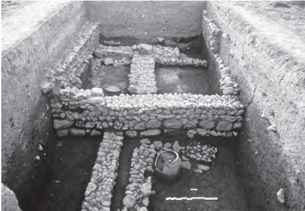
FIGURE 7 : LES TROIS NIVEAUX D'HABITAT MÉDIÉVAL DU SONDAGE D1 (CLICHÉ C. KEPINSKI).

fait de l'arasement des structures et en l'absence d'étude du matériel, il est difficile d'attribuer ces éléments à une période précise du Moyen-Âge. Dans le sondage H, en revanche, ont été retrouvés les traces d'une rue ainsi que trois niveaux d'habitat de la fin XII e -XIII e siècle 36 .