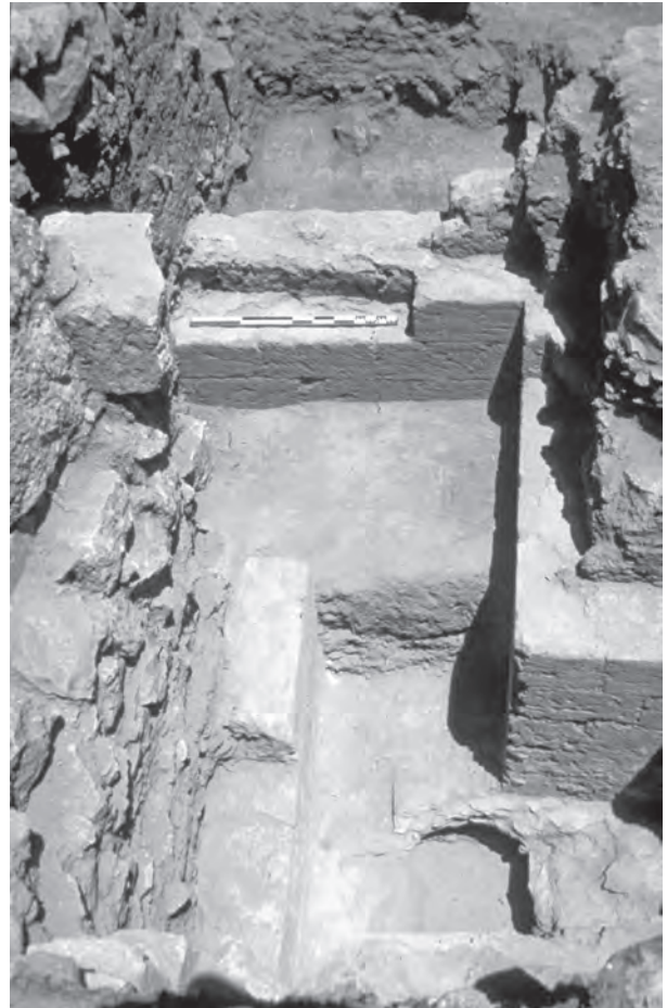
FIGURE 6 : RÉAMÉNAGEMENTS AYYOUBIDES DANS LA PIÈCE ORIENTALE DE LA RÉSIDENCE SUR LA CITADELLE.

À cette époque, les villes basses nord et sud sont largement occupées. Dans la ville basse nord, plusieurs maisons ont été en partie fouillées. Elles montrent plusieurs états de construction différents (2 à 3) mais selon la même orientation : celle des remparts à proximité (sondages B, C, D). Les murs sont construits avec de petits moellons de pierre et de plus gros à leur base. Le sondage B a permis de découvrir deux pièces juxtaposées, utilisées pendant un assez long laps de temps : plusieurs sols sont superposés sur un radier de grosses pierres. Un trésor de 34 dirhams a été découvert (sondage B) 31 . Il comportait des pièces frappées au nom du dernier calife abbasside al-Mu'tasim et de l'émir ayyoubide Salah al-Din II, ainsi