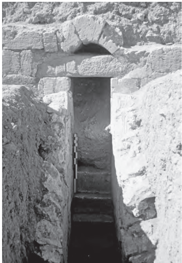
FIGURE 4 : LA POTERNE.