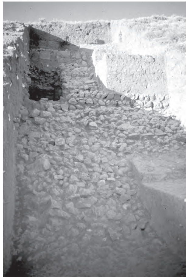
FIGURE 2 : LE GLACIS DE LA CITADELLE DU X e SIÈCLE, VU DU SUD DANS LE SONDRAGE E.

Vers le X e siècle, la colline artificielle a été retaillée et aménagée pour recevoir une fortification de terre. La tranchée E a montré un rempart en briques crues reposant sur un soubassement en pierre, qui couronnait le sommet. Il comprenait des redans ; celui qui a été dégagé était consolidé par un contrefort en brique crue. Il était complété par un glacis formé de blocs de pierre de taille moyenne, non taillés, pris entre deux couches de mortier de terre et soutenu par des murets parallèles à sa pente, d'environ 35 degrés (figure 2). Il était doublé, 4 m plus loin, par un mur plus bas, en brique crue sur un socle à double parement en petits blocs de pierre posés en épis, édifié en partie sur le glacis et en même temps que lui 7 . Le glacis devait recouvrir l'ensemble des pentes du tell car des murets parallèles ont été observés au sud-est 8 et,