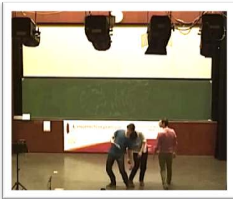
Figure 23 – Accompagnement, performance « comment chacun s'ajuste en permanence » 46