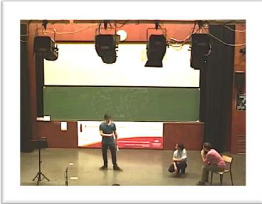
Figure 19 – Accompagnement, performance « Don't tell... » 32