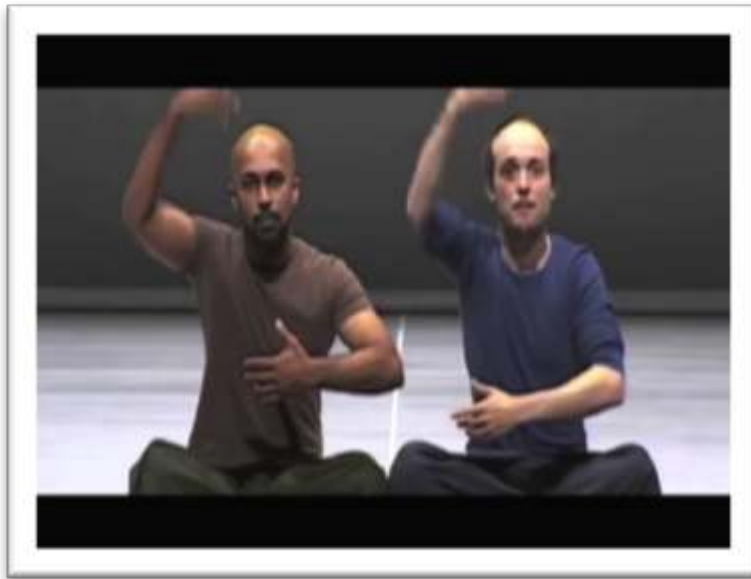
Figure 1a – Exemple de gestualit  coverbale rejou e The SUN WAS UP..