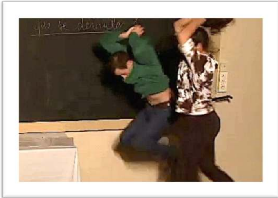
Figure 13 - Exemple de gestualité coverbale rejouée et augmentée She picks up the guitar and SMASHES IT! 22