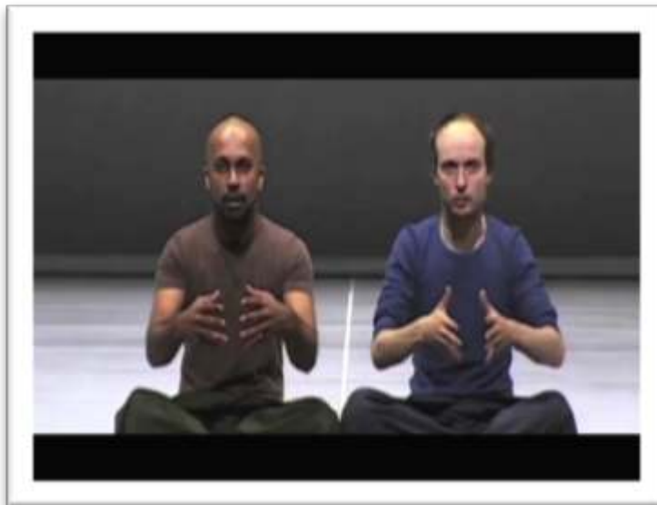
Figure 1c – Exemple de gestualité coverbale rejouée ... who had CONGREGATED AROUND THE BUS 3