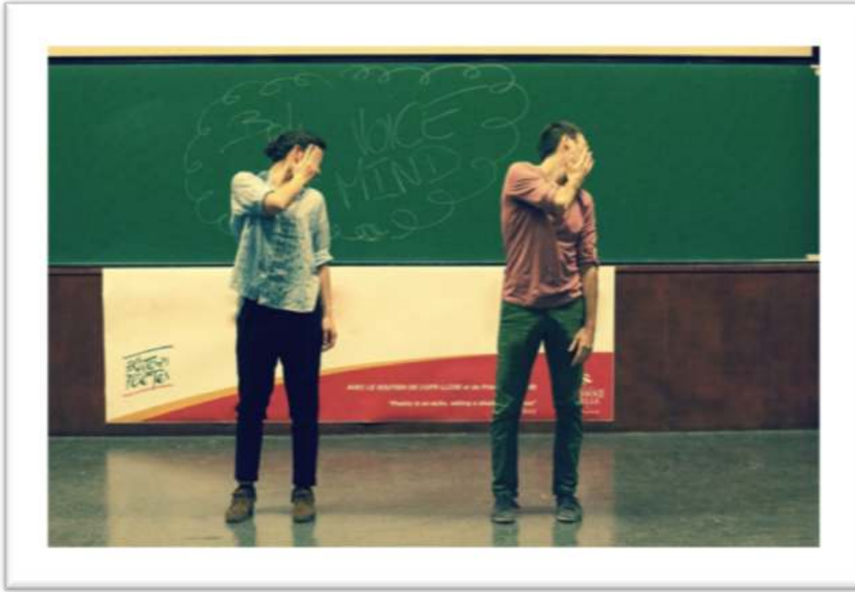
Figure 10 - Exemple de gestualité coverbale rejouée (et augmentée) Someone hits you in the face AND YOU GO « OW! » 15