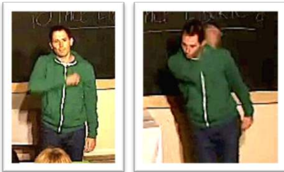
Figure 26 – Exemple de gestualité coverbale rejouée + variation personnelle IT IS NOT JUST SNAP OUT OF IT! Things will get better! Look on the bright side! 54

36 Mais les « variations » nous appartiennent et nous restons libres de les développer.