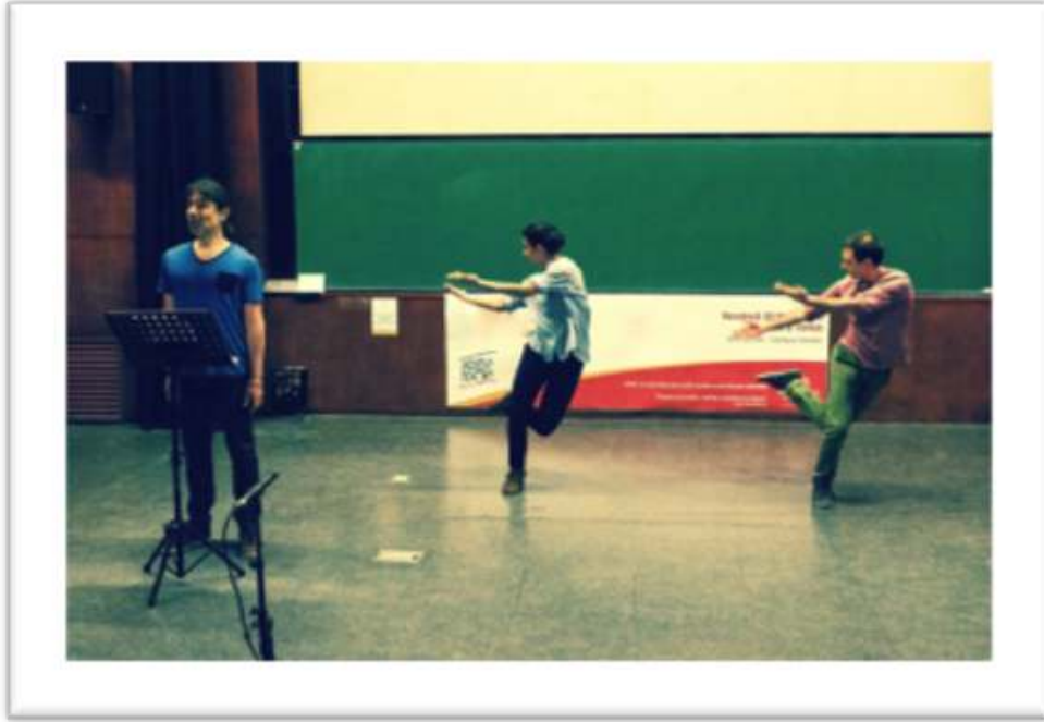
Figure 4 – Accompagnement, performance « ... jeté dans la vie, et parce que vivant » 8