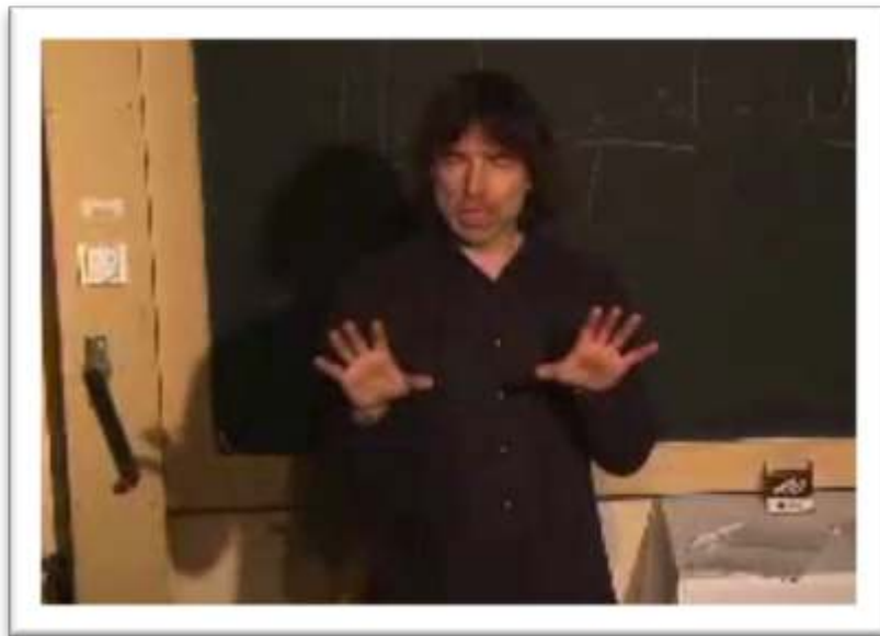
Figure 9 - Exemple de gestualité coverbale rejouée It's such A BLACK WALL OF NOTHINGNESS! Nothingness – Le néant, le vide as the French would say. 14