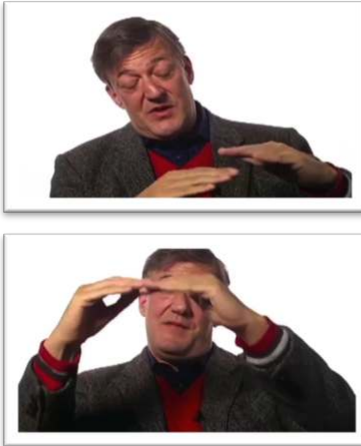
Figure 12 - Exemple de gestualité coverbale authentique (locuteur autochtone) You have A DEPRESSED MOOD. You have AN ELEVATED MOOD. That's mania ! 17