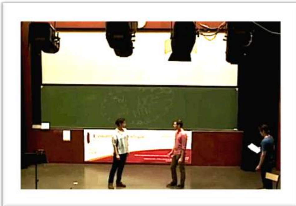
Figure 22a – Exemple de gestualité coverbale rejouée En fait, TU ÉTAIS AU COURANT et tu m'as rien dit !