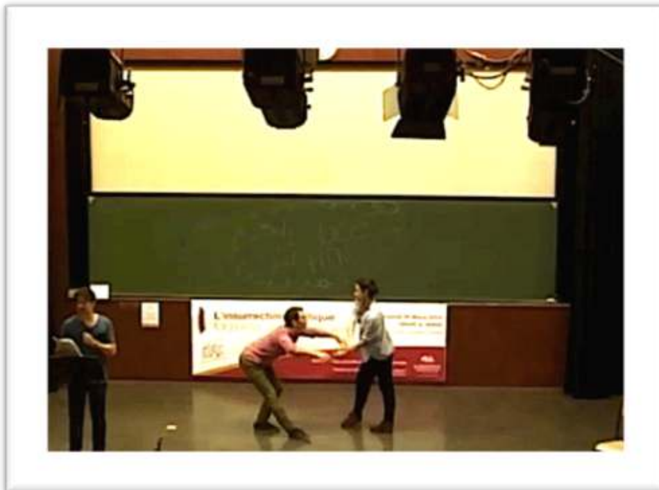
Figure 20 – Accompagnement, performance « Nous éprouvons le besoin d'aller au théâtre... » 34