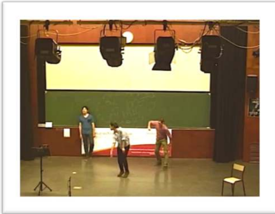
Figure 18 – Accompagnement, performance « I made my song a coat... » 31