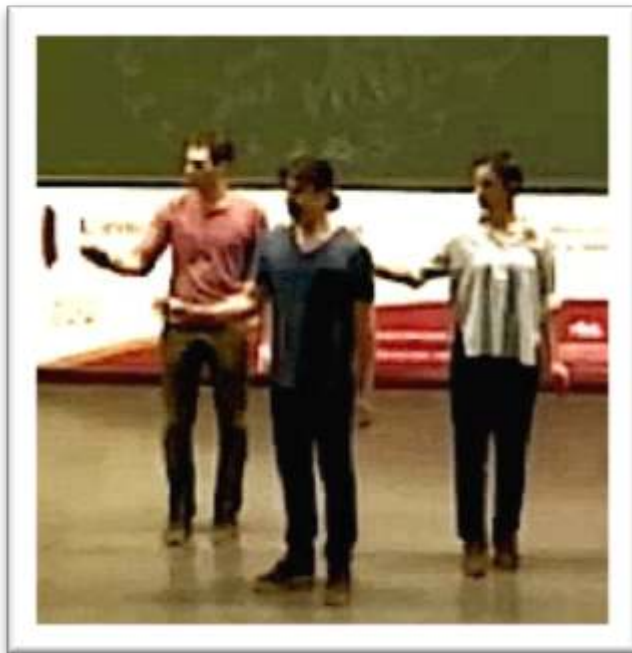
Figure 15 – Accompagnement, performance « ...she dipped too into the past » 25