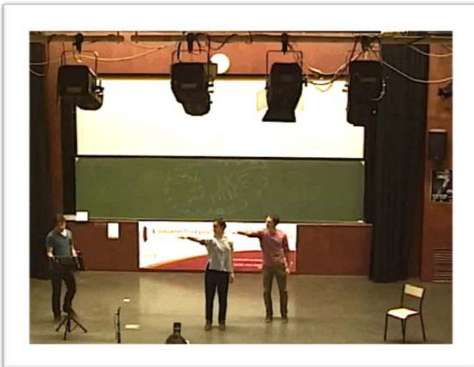
Figure 6 - Réponse 2 : horizon 11

(Réponse gestuelle des danseurs évoquant quelque chose qui s'étire, au loin, là-bas).