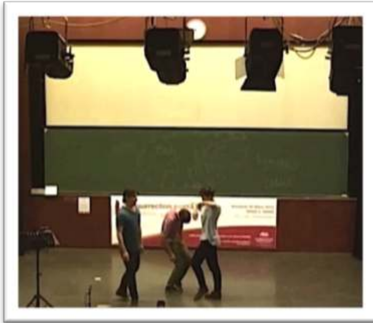
Figure 28 – Accompagnement, performance « Amor à chuva ... » 60