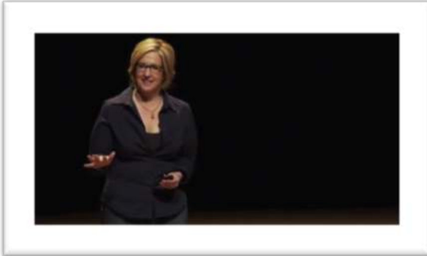
Figure 27 - Gestualité coverbale spontanée, locutrice autochtone I started reading the comments. They were DEVASTATING. 56