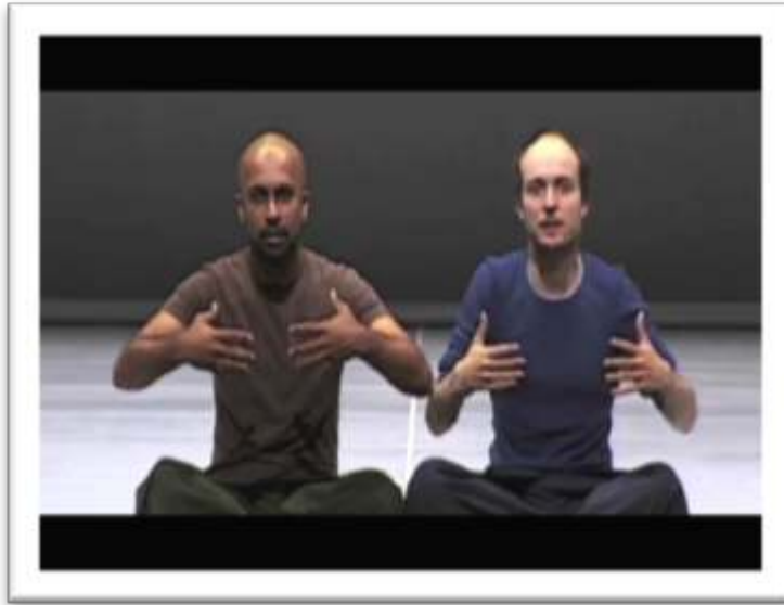
Figure 1b – Exemple de gestualité coverbale rejouée ...and I could feel THIS REAL TENSION BETWEEN the people