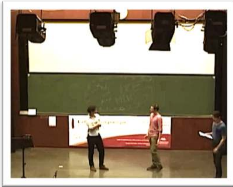
Figure 22b – Exemple de gestualité coverbale rejouée C'ÉTAIT PAS FACILE ! 42