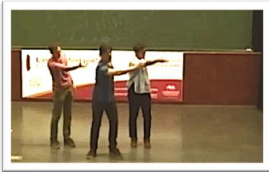
Figure 16 – Accompagnement, performance « Is it a lobster pot, is it an upturned boat?» 26

Mrs. Ramsay was now silent. She was glad, Lily thought, to rest in silence, uncommunicative; to rest in the extreme obscurity of human relationships. Who knows what we are, what we feel?