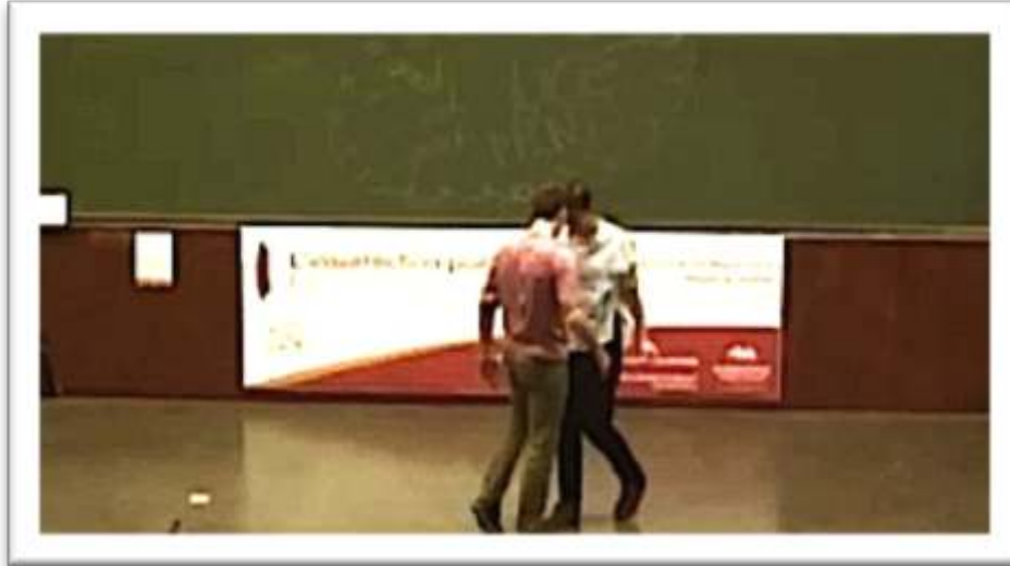
Figure 21 – Accompagnement, performance « Entrer en présence... présenter son être... » 39