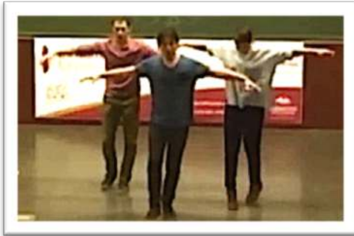
Figure 14 – Accompagnement, performance « ...alone over the sea » 24