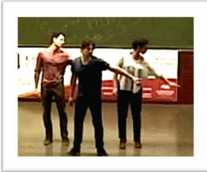
Figure 17 – Accompagnement, performance « ... and struck the object inches too low » 27

inches too low. For how could one express in words these emotions of the body? express that emptiness there?