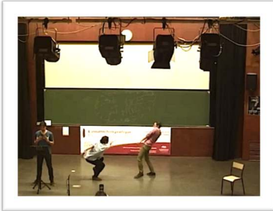
Figure 7 : Accompagnement, performance « Je peux absorber le monde »