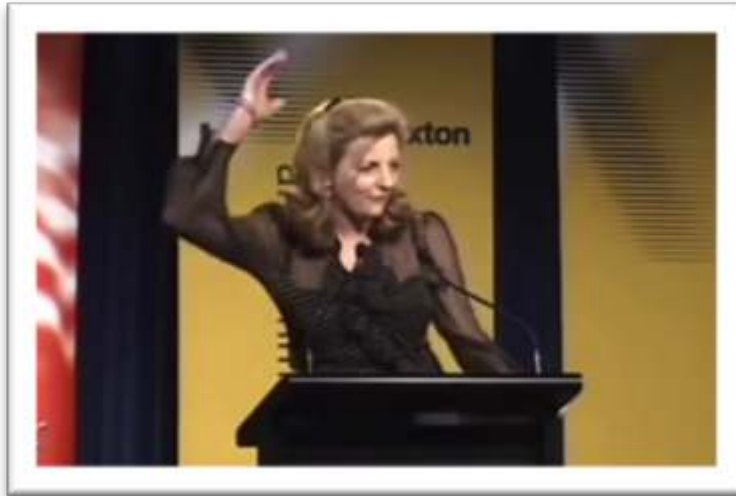
Figure 2 – Exemple de gestualité coverbale authentique Is it a call to let the good time roll and LAUGH IN THE FACE OF ADVERSITY? 4