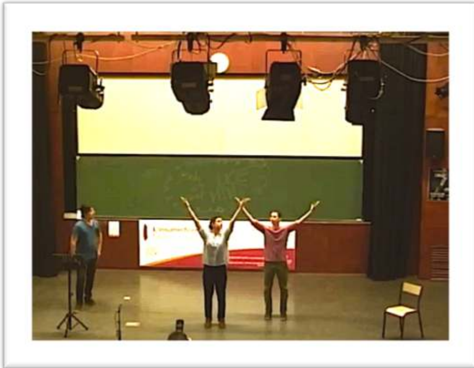
Figure 5 - Réponse 1 : arbre 10