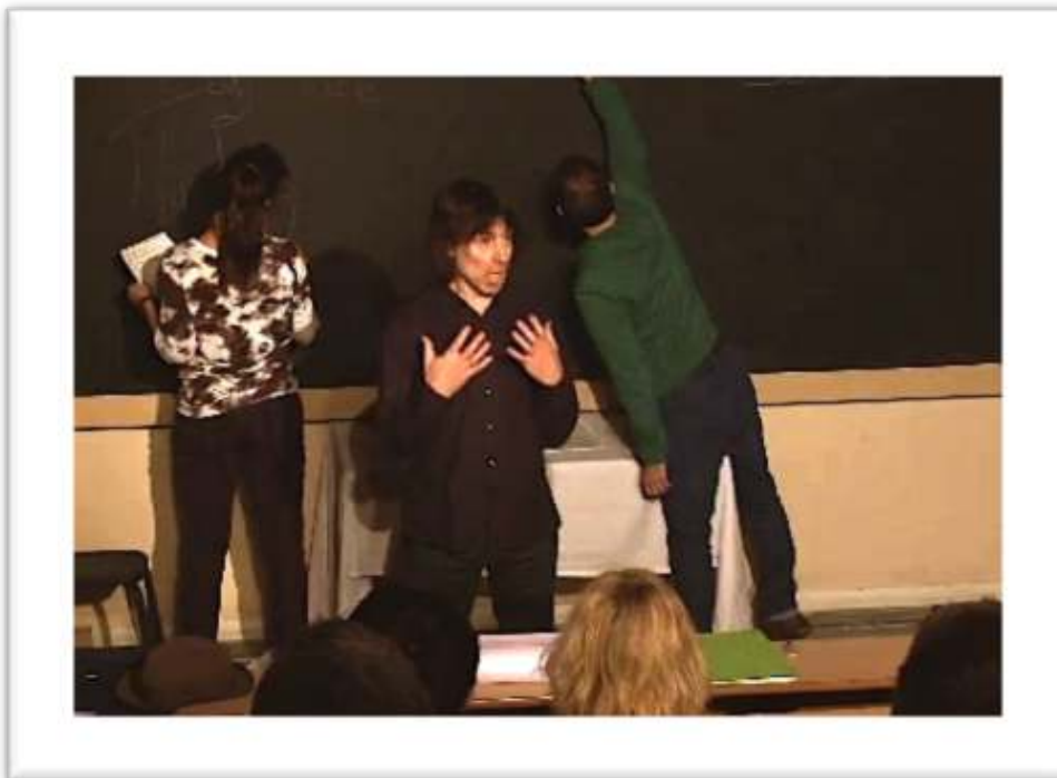
Figure 3 – Exemple de gestualité coverbale rejouée The idea that life is refinable and improvable, that YOU CAN LEARN A TECHNIQUE FOR EVERYTHING... 5