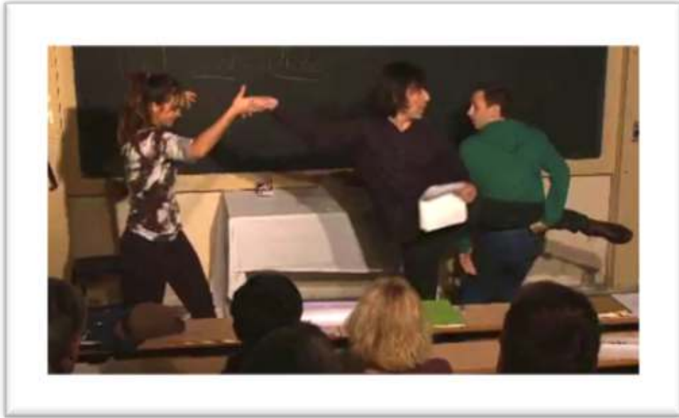
Figure 24 – Accompagnement, performance « les gestes et les pas d'une danse... » 48