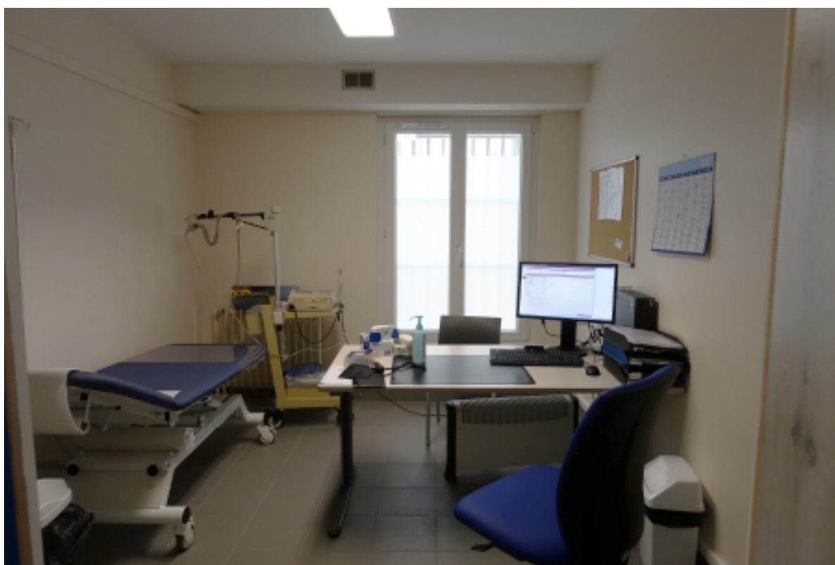
IMAGE 8. UNITE SANITAIRE, SALLE DE CONSULTATION