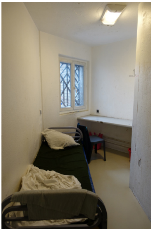
IMAGE 5. CELLULE EN MAISON D'ARRET

qui nous a rejoints lors de l'avant dernière cellule, fait également le lien entre les filles qui ne se respectent pas (notamment à travers leurs comportements sexuels