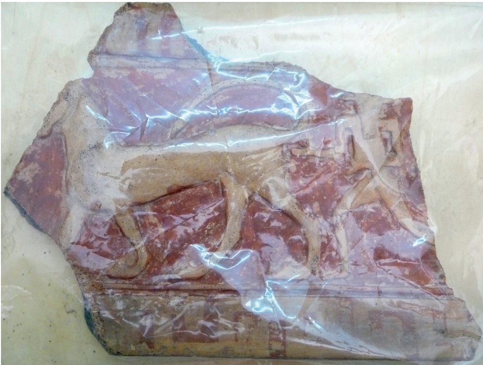
Figure 3 Le « Minotaure » de la regia de Gabies.

1899 jusqu'aux récentes recherches menées par l' American Academy in Rome ; la publication contient également une transcription intégrale du manuscrit du journal des fouilles de G. Boni et propose, pour finir, une analyse des différentes hypothèses et interprétations archéologiques et historiques qui ont pu être avancées par le passé [18].