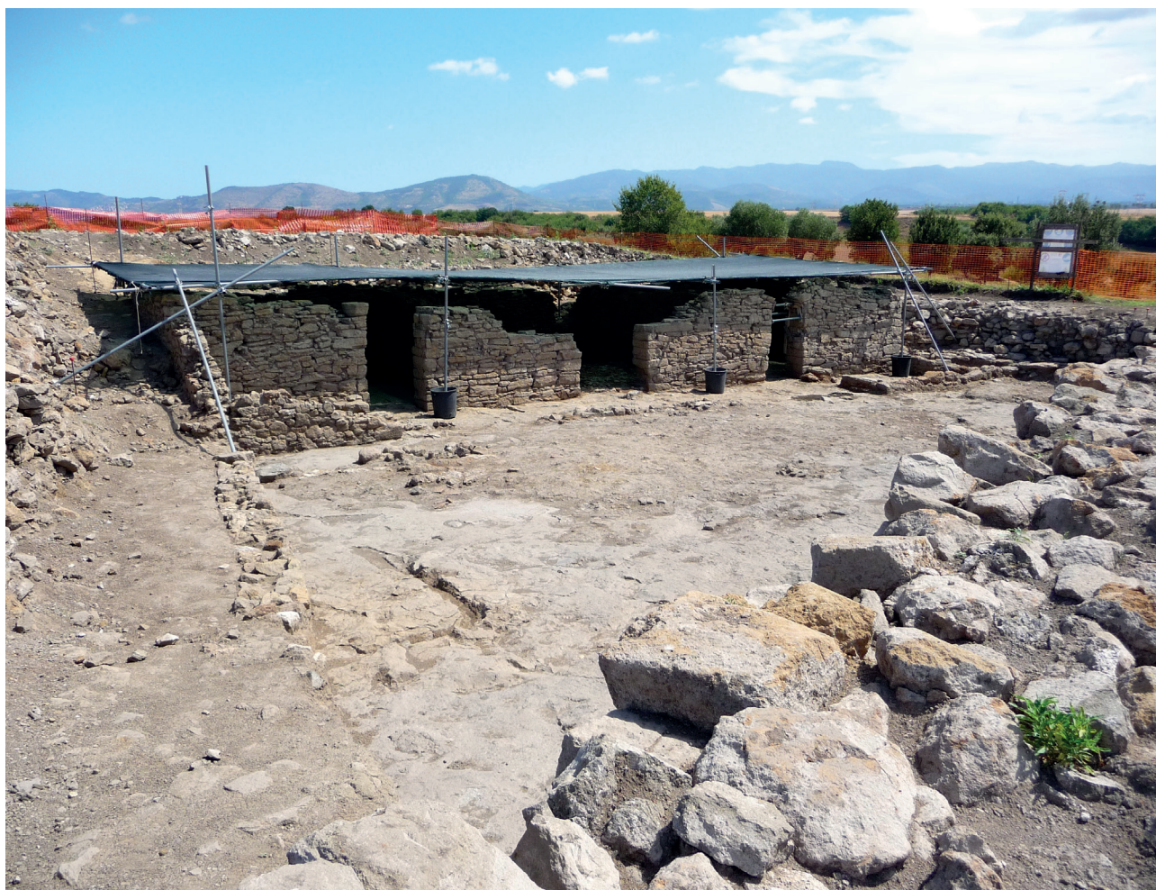
Figure 2 La cour et les bâtiments de la regia de Gabies.

[17] FABBRI, MUSCO & OSANNA 2010 ; Ird. 2012 ; FABBRI 2017. La regia de Gabies semble avoir été « défonctionnalisée », peut-être parce qu'elle avait appartenu à Sex. Tarquin, le fils du Superbe (cf. Tite-Live , I, 53, 4-54, 10).