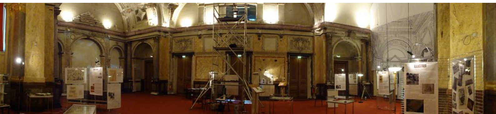
Figure 8 : exposition Cent mille ans et quelques minutes , 2011