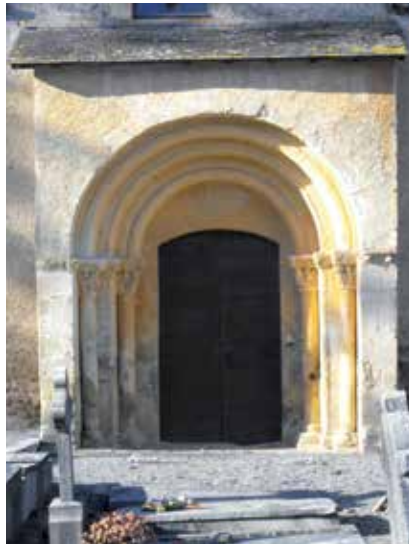
3 - Lannecaube (Pyrénées-Atlantiques), église Saint-Pierre, portail, fin du XII e siècle.