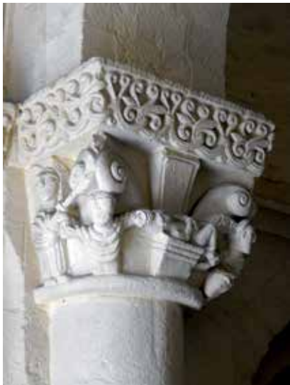
1 - Sacrifice d'Abraham . Bordeaux (Gironde), basilique Saint-Seurin, porche ouest, chapiteau, milieu du XI e siècle (cl. É. Rigault).