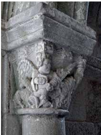
2 - Sacrifice d'Abraham . Nogueira de Ramuín (Galice), monastère Santo Estevo de Ribas de Sil, cloître des Évêques, chapiteau, vers 1220.