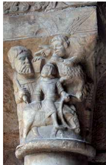
5 - Sacrifice d'Abraham . Tarragone (Catalogne), cathédrale Santa María, cloître, chapiteau, fin du XII e siècle.

De l'autre, certaines compositions, moins répandues, étirent le récit par l'ajout significatif de détails, de personnages ou de scènes parfois absents ou simplement suggérés dans le texte d'origine. On peut par exemple se référer aux chapiteaux du chœur de l'église de Saint-Quentin-de-Baron (Gironde) (ill. 6), où le sacrifice est complété de scènes originales ayant été interprétées comme la circoncision d'Ismaël, frère aîné d'Isaac, la rencontre d'Abraham et du prêtre-roi Melchisédech et les embrassades de quatre habitants de Sodome 8 . Précisons également que les images hésitent souvent à définir Abraham ou Isaac, voire le bélier 9 , comme figure principale de l'épisode, et donc à insister sur la piété du père ou sur le sauvetage du fils.