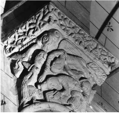
9 - Sacrifice d'Abraham . Saint-Caprais-de-Bordeaux (Gironde), église Saint-Caprais, arc triomphal, chapiteau, face gauche, deuxième tiers du XII e siècle.