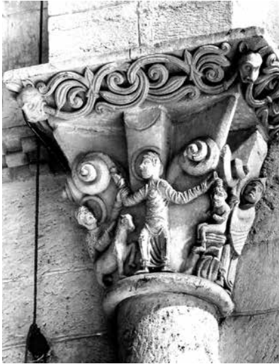
12 - Sacrifice d'Abraham . Le Mas-d'Agenais (Lot-et-Garonne), collégiale Saint-Vincent, arc doubleau de l'absidiole sud, chapiteau, seconde moitié du XII e siècle.

Alors que la posture d'Isaac tranche avec la passivité habituelle du jeune homme et pourrait traduire son consentement, un petit oiseau posé près d'Abraham 23 pourrait symboliser l'ordre divin donné au patriarche ou bien, à l'instar de la colombe de Grégoire le Grand, le Saint-Esprit venu reconforter un personnage, rappelons-le, privilégié dans sa relation à Dieu. Le geste meurtrier du père est ensuite interrompu par le vol impressionnant d'un ange qui bloque non pas le glaive d'Abraham, comme cela est bien souvent le cas, mais la main empoignant la touffe de cheveux d'Isaac.