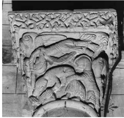
10 - Sacrifice d'Abraham . Saint-Caprais-de-Bordeaux (Gironde), église Saint-Caprais, arc triomphal, chapiteau, face centrale, deuxième tiers du XII e siècle.