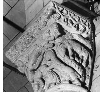
11 - Sacrifice d'Abraham . Saint-Caprais-de-Bordeaux (Gironde), église Saint-Caprais, arc triomphal, chapiteau, face droite, deuxième tiers du XII e siècle (© Région Nouvelle-Aquitaine, Inventaire général - Dubau, 1983).

et notamment celui d'Isaac, peuvent avoir été comparés à certaines pratiques plus spécifiques, comme l'ordination cléricale, sorte de sacrifice symbolique à la divinité, et l'oblation, ou don d'un enfant à une communauté religieuse. C'est d'ailleurs par la référence aux oblats qu'on a été réinterprétées des œuvres aussi fameuses que le trumeau de l'abbatiale Sainte-Marie de Souillac (Lot) 19 .