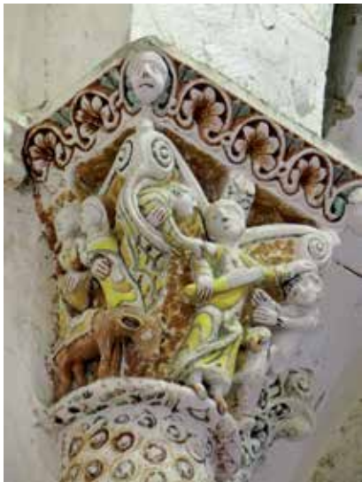
7 - Sacrifice d'Abraham . Mazères (Castelnaud-Rivière-Basse) (Hautes-Pyrénées), église Saint-Jean-Baptiste, arc triomphal, chapiteau, première moitié du XII e siècle (cl. wikisource.org).