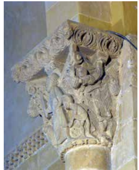
4 - Sacrifice d'Abraham . Lescar (Pyrénées-Atlantiques), cathédrale Notre-Dame-de-l'Assomption, arc triomphal, chapiteau, vers 1100 (cl. É. Rigault).

Le thème fut représenté avec constance pendant toute la période. L'occurrence la plus ancienne pourrait être un des chapiteaux de la tour-porche occidentale de la basilique Saint-Seurin de Bordeaux (Gironde) (ill. 1), que l'on peut faire remonter au milieu du XI e siècle, et la plus récente serait un chapiteau de l'aile orientale du cloître des Évêques, au monastère Santo Estevo de Ribas de Sil (Galice), daté vers 1220 4 (ill. 2). La diffusion spatiale de l'image présente, elle aussi, une certaine homogénéité et confirme le dynamisme de régions stimulées par d'importants foyers de création, comme la Castille septentrionale. Par ailleurs, hormis la polychromie des sculptures, qui demeure mal conservée mais qui peut avoir orienté la lecture des images en jouant sur le symbolisme des couleurs, il est à noter que la peinture murale fait clairement défaut à notre inventaire, puisque seuls peuvent être signalés les cycles peints à l'arc triomphal de l'église Sant Quirce de Pedret (Catalogne) et dans la salle capitulaire du monastère Santa María de Sigena (Aragone) 5 .