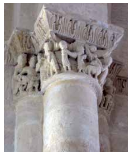
6 - Histoire d'Abraham . Saint-Quentin-de-Baron (Gironde), église Saint-Quentin, arc doubleau intermédiaire du chœur, chapiteaux, deuxième tiers du XII e siècle.