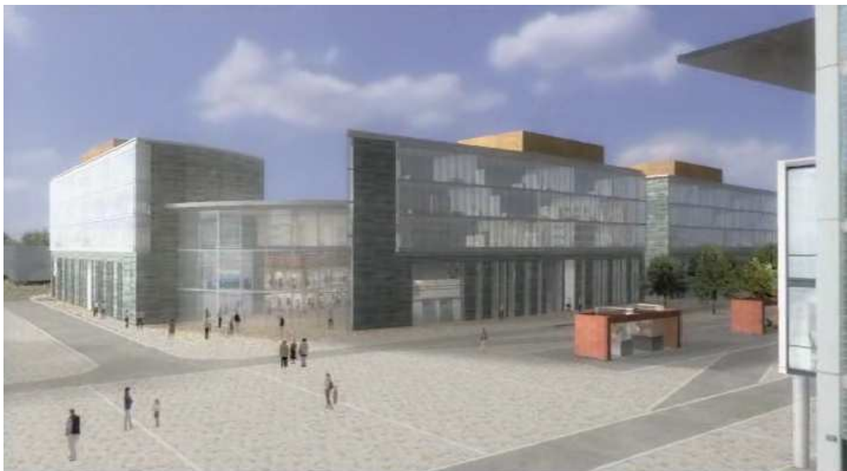
Figure 3 : Image issue de la simulation 3D du nouveau quartier des 2 Lions à Tours

sont fondées sur des images. Que l'image confirme ou infirme la représentation que les habitants se font de leur quartier, elle a un certain pouvoir de « sidération » dans le sens de Baudrillard (1981), en tout cas dans un premier temps. Lors de la diffusion de la vidéo, le discours sur le projet était brouillé par l'image, qui établissait une forme de certitude par rapport aux paroles des acteurs qui la commentaient sur le registre du possible. Pour appuyer ce point, nous pouvons citer certaines « précautions » que l'on voit de plus en plus fréquemment apparaître dans les vidéos de ce type, soulignant le caractère non contractuel des images diffusées.