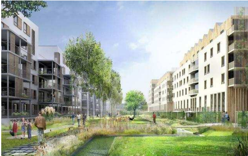
Figure 2 : Visuel proposé par le promoteur des logements de standing en construction dans le quartier des 2 Lions à Tours

question des espaces verts et de leur entretien. Ces échanges ont montré le grand attachement des habitants à leur cadre environnemental, et il a été fait référence aux images du projet qui prévoyaient de larges espaces verts, faisant encore défaut.