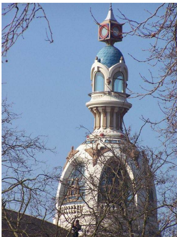
V.Veschambre, mars 2005.