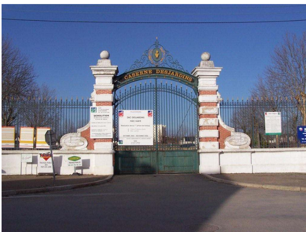
(V.Veschambre, mars 2006)