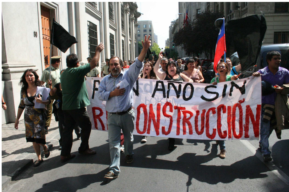
Figure 2. Manifestation du MNRJ et de la FENAPO " 1 année sans reconstruction " à côté du palais présidentiel de La Moneda au Santiago.

En parallèle, les mouvements de victimes du tremblement de terre et tsunami se sont articulés au sein d'un mouvement plus ample nommé Mouvement National pour la Reconstruction Juste (MNRJ). Un des événements importants du mouvement a été la « Première rencontre nationale des sinistrés » qui a eu lieu le 5 octobre 2010 dans le cadre de la Journée Mondiale de l'Habitat organisée à la « Villa Olímpica » de Santiago, un des lieux les plus touchés par le séisme de la Région métropolitaine de Santiago, et auquel ont participé de nombreuses organisations qui travaillaient sur le thème de la reconstruction dans leurs localités.