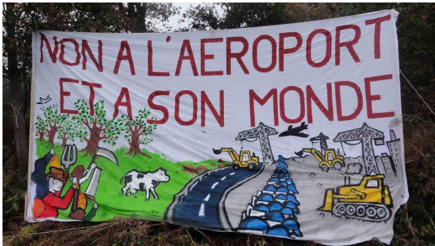
Illustration 5 : Affichage le long d'une route lors de la manifestation de réoccupation le 17 novembre 2012.