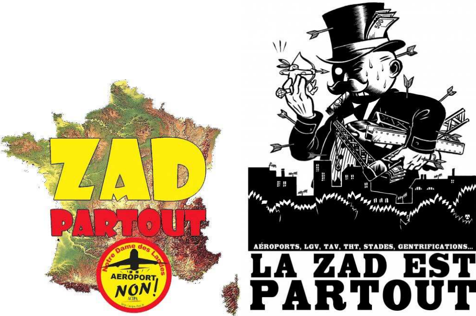
Illustrations 3 et 4 : Exemples d’affiches « ZAD partout ».

Et plus il en arrivait, plus le sigle se vidait de sa signification première. À la place : des constructions, des amitiés, des moments de poésie pure, mais aussi des querelles internes pas toujours surmontées, des voix discordantes, des méfiances rentrées ; et tout cela a contribué – par le fait de rencontres incessantes, de paroles vives, de pratiques communes, de solidarité agissante face à l’ennemi commun – à constituer ce lieu comme Zone à défendre » (Coordination, 2013 : 4).