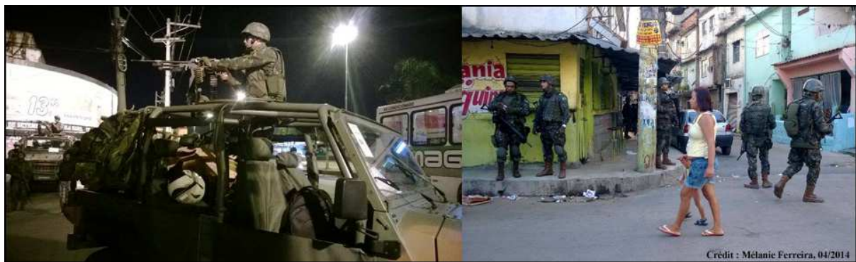
Illustration 2: avril 2014, l'armée venue en renfort lors de la pacification du complexe de favelas de Marê, situé dans la zone nord de Rio de Janeiro.

La présence quotidienne de policiers armés dans les rues des favelas pacifiées contraint les habitants à s'adapter à de nouvelles règles et pratiques sociales qui peuvent susciter au départ une certaine résistance; ce qui avant était résolu par les groupes criminels l'est aujourd'hui par la police. L'élargissement des fonctions dévolues à la police désoriente une partie de la population quant au comportement à adopter face à des policiers à la fois détenteurs de la violence légitime, médiateurs et parfois même éducateurs. Il y aurait un transfert de responsabilités de gouvernance