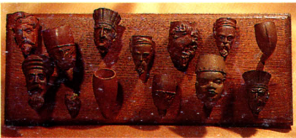
Fig.128 : Ensemble de pipes fabriquées à Jouques