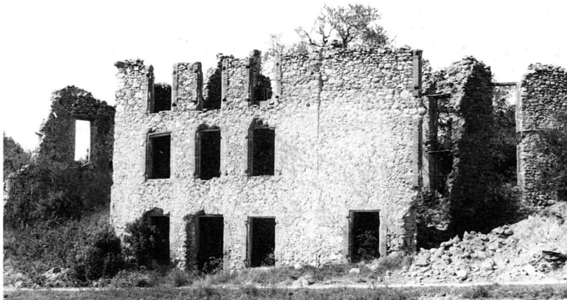
Fig.127 : Les ruines de la fabrique de Villemus, Jouques

long sur 9m de large dont la façade et les montants de fenêtres en briques ont un aspect industriel. Elle est accolée à une construction de dimensions semblables (l'ancienne ferme) qui a encore des piédroits de fenêtre en pierre taillée. Plusieurs petites constructions attenantes (dont deux viennent d'être rasées), encadrent ce grand ensemble de plus de 30m de long. Les restes d'un four carré sont encore visibles dans un petit bâtiment étroit où l'arc surbaissé de l'entrée du foyer est encore bien conservé.