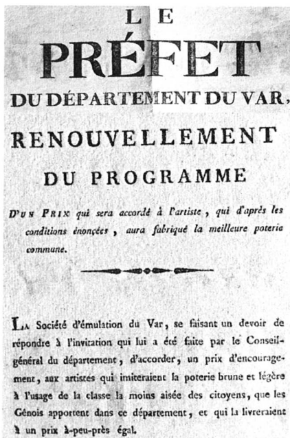
Fig.126 : Affiche organisant un concours pour l'imitation des poteries génoises, Société d'Emulation du Var, An XII.