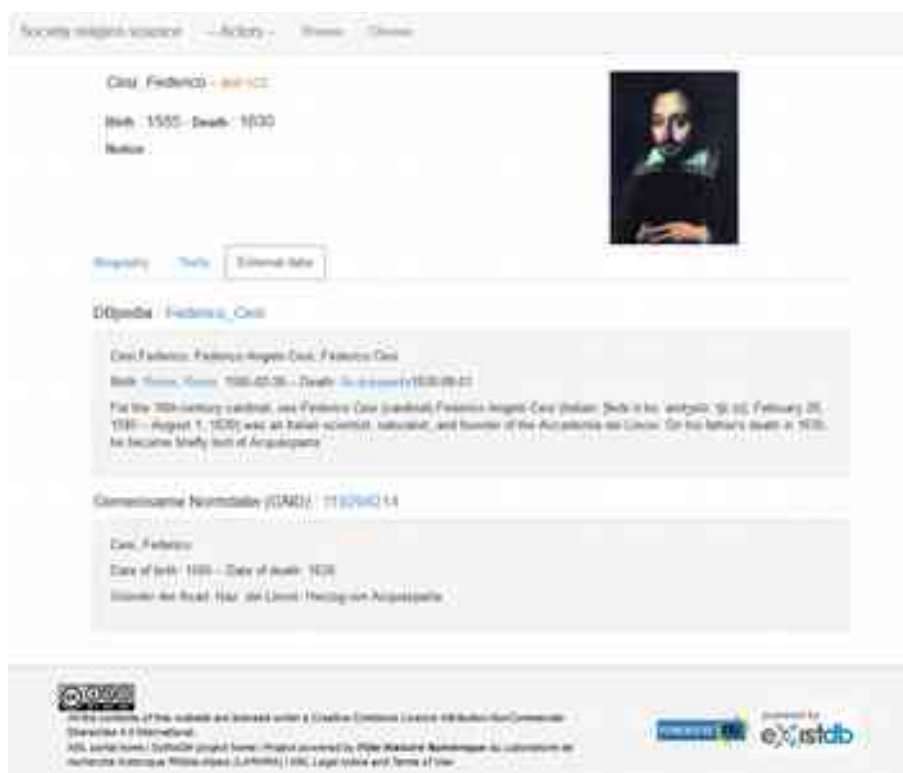
Figure 5. 'Fiche' d'un acteur

nous aimerions mettre en place un parcours de lecture fluide pour passer dans un même environnement du texte aux objets et aux unités de connaissance, pour rebondir enfin sur d'autres portions de textes, regroupées dynamiquement en fonction des intérêts du lecteur.