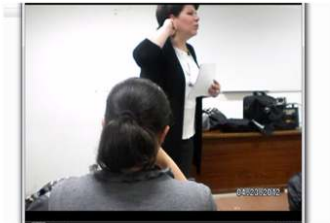
Figure 4 – Le geste accompagnant le mot « pardon » pour amener à parler plus fort