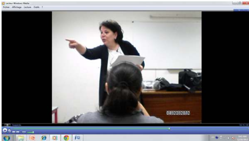
Figure 3 – Le geste accompagnant le mot « pardon » désignant un apprenant pour parler