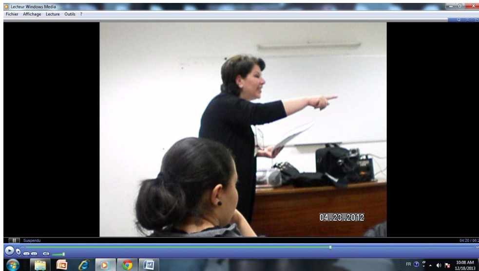
Figure 5 – Le geste accompagnant le mot « pardon » pour faire « parler mieux »