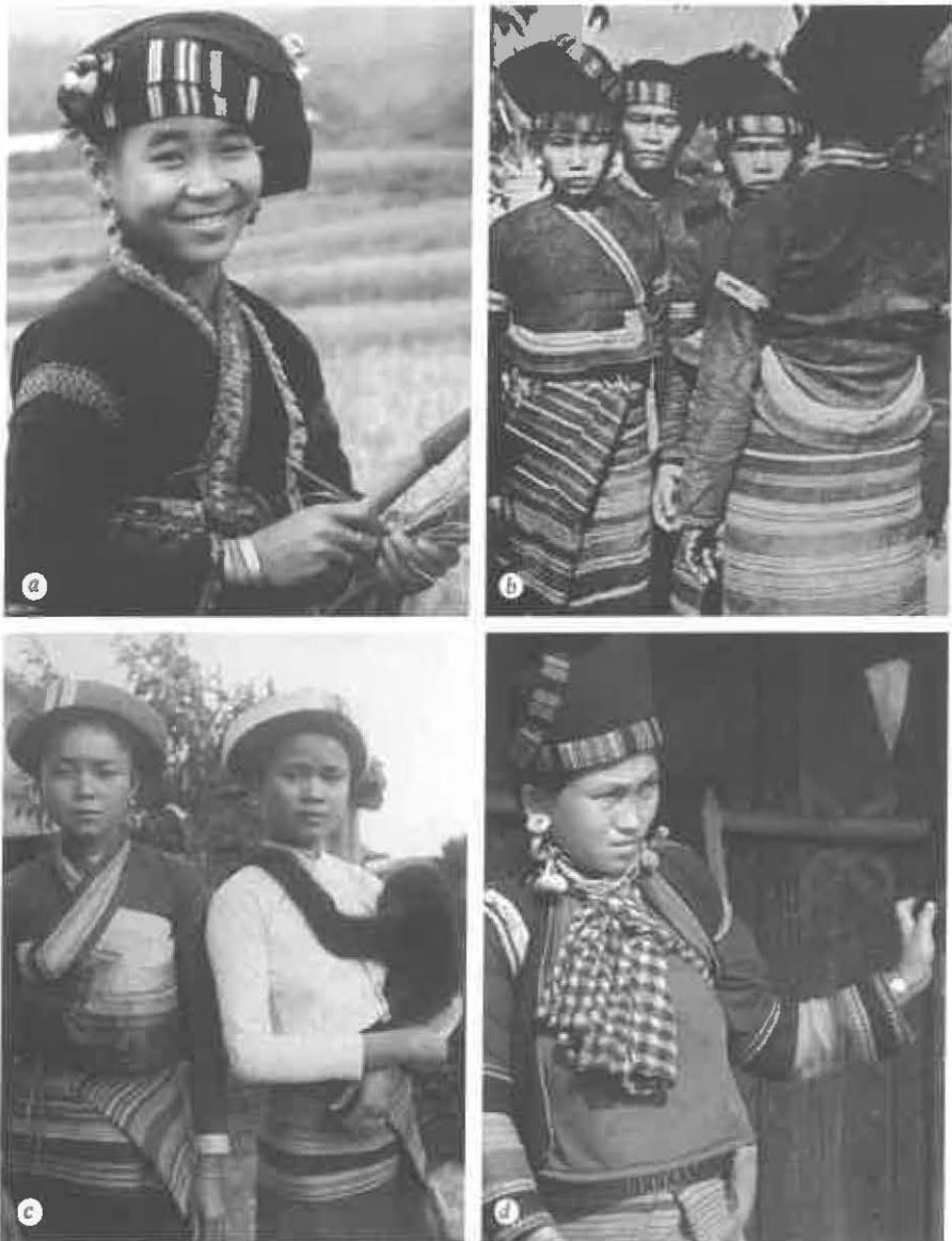
Fig. 2. Costumes des Tai Lu du Viêt-Nam, en regard de ceux des Tai Lu et des Mouchi du Laos